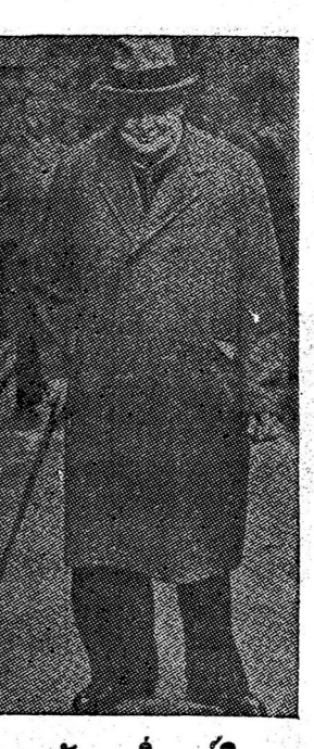
นายกรัฐมนตรี เซอร์ซีดี อยู่ มากแต่ภายหลังมีมติงดเว้น งานนี้โดยเด็ดขาดไปเลย

เราจัดให้ข้าพเจ้าพักอยู่ในห้องชั้นห้า ห้อง เลขที่ ๕๕๕ ในห้องพักผ่อนนอน โต๊ะเขียน หนังสือ และโทรทัศน์ ตู้ใส่เสื้อผ้า และตู้ สำหรับแขวน มีประตูติดกับห้อง มีห้องนอน ในห้องพักโดยเฉพาะ ในห้องนี้มีตู้เสื้อผ้า สำหรับแขวน ซึ่งมีตู้ ๒ ตู้ ตู้สำหรับ ๑ ตู้ ตู้สำหรับ ๑ ตู้ มีอ่างอาบน้ำ ซึ่งมีตู้ ๒ ตู้ ตู้สำหรับเขียน และมีตู้โครกพร้อมบรรณ ห้องพักผ่อนราคาวันละ ๔ ดอลลาร์ครึ่ง ๖ ดอลลาร์ ครึ่ง และสูงกว่านั้น โรงแรมนี้ประตูเปิด ออกท่า