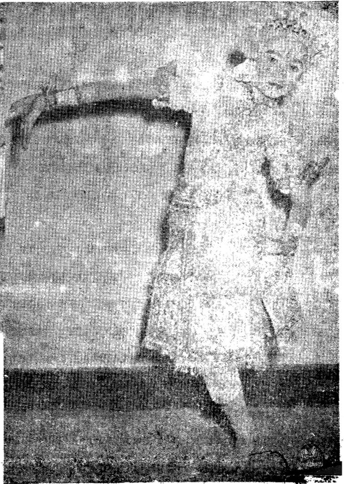
พระองค์เจ้าพี่นางเธอ เจ้าฟ้ากัลยาณิวัฒนา กรมหลวงนราธิวาสราชนครินทร์ เสด็จในงานรื่นเริง ร.ร. เซนต์โยเซฟ คอนเวนต์