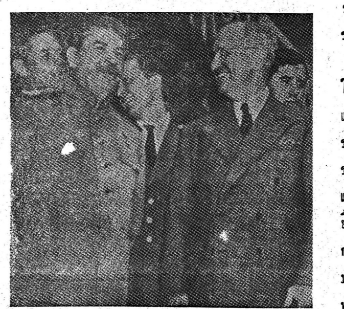
รอยจาก ระหว่างเสด็จ กับทนายเม ที่ปอร์ตแลนด์

นอร์ธแมน โฮเตล เป็นโรงแรมชั้นดี ใหญ่โต และสะอาด มีห้องรับแขกและห้องกินอาหาร มีห้องสำหรับพักผ่อน ๒๐๐ ห้อง ตั้งอยู่ที่ ถนนบรอดเวย์ ติดกับถนนชอสมอน