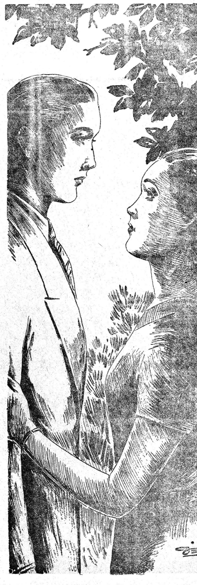
วราห์ น้อย เต็ม ด้วย ความ