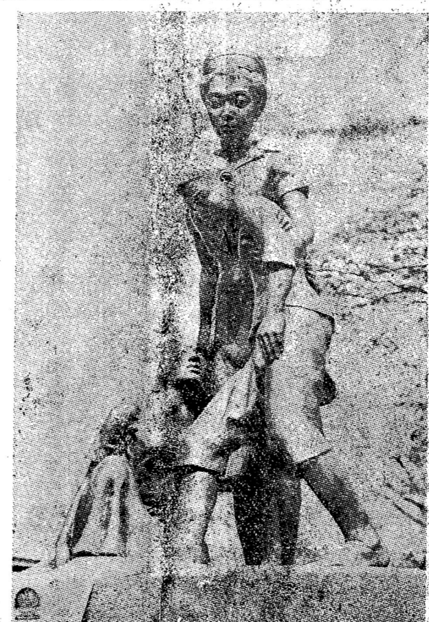
รูปปั้นอนุสาวรีย์แห่งความเมตตาของโรงพยาบาลโรจิตต์ จ. รมบุรี เป็นสัญลักษณ์แสดงถึงการที่คนใจโรจิตต์ได้ รับการรักษาพยาบาลจากทางการ

รายวัน 19 (กมล) /เพลิน จิตต์ (ชอิม) เลขา พระที่อาละวาด ขมรดไฟถูกเรียก เปลือยผ้าสาวพรหม กอดความเสียมเสีย ให้แวง การส่งช้อก แล้วส่งเข้า เรือนจำ เพื่อกำเนินคดีในข้อ หาชกชน และละสุ เจ้าพนักงาน