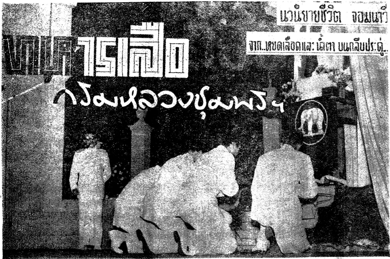
ฉาก...ชุดเสื้อและ เบล่า บนเก้าอี้ประตู... หนังลายชีวิต จอมแห้ว