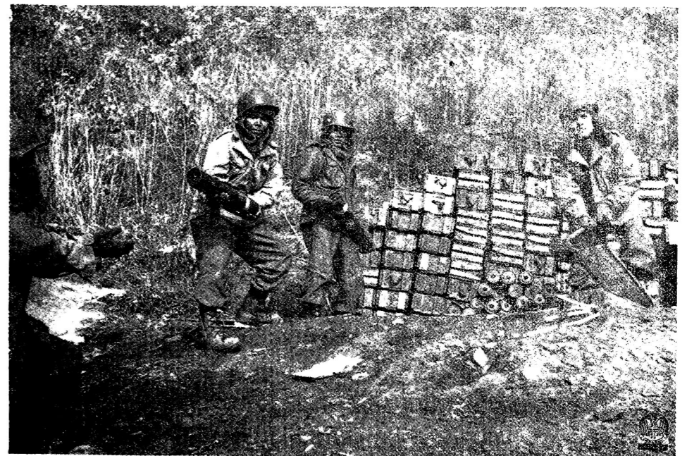
กรมทหารราบที่ ๒๑ ในเกาหลี - ทหารไทยกำลังเลี้ยงกระสุนปืนใหญ่ที่เพิ่งได้รับมา

ความข่าวที่วาระใกล้ถึงสมมาชิกสภาผู้แทนราษฎรออกไปทำงานต่างประเทศนั้นได้มีหลายประเทศได้ติดต่อเชื้อ เชิญมาเพื่อให้ไปทำงานประเทศของตน โดยเฉพาะประเทศของกฤษโศกค้อมมา และหลายบริษัทได้ให้ความช่วยเหลือในการที่จะ