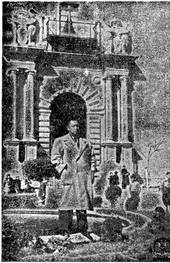
ผู้เขียนและภรรยาที่สวนสาธารณะแห่งหนึ่งในจังหวัดภูเก็ต ประเทศสเปน