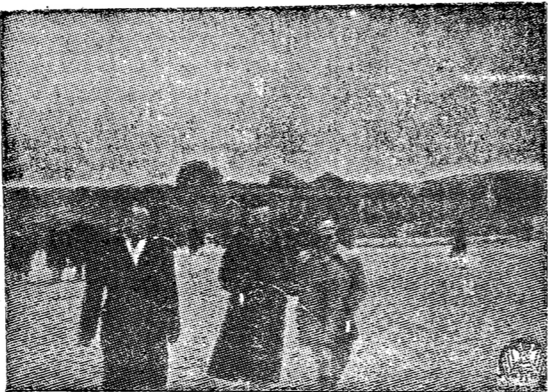
ผู้เขียนและภรรยาที่สวนสาธารณะแห่งหนึ่งในจังหวัดภูเก็ต ประเทศสเปน