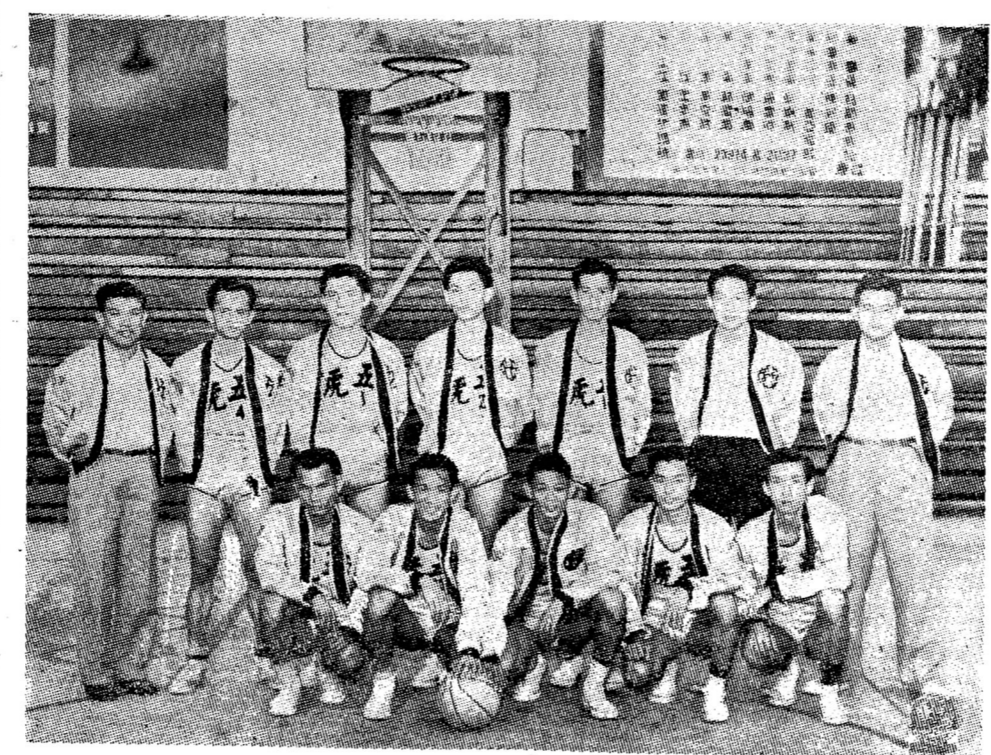
คณะบาสเก็ตบอล "เสือกรุงเทพ" จะแข่งขันกับคณะบาสเก็ตบอล อเมริกัน ณ สมาคมเตโชย เชียง โรงพยาบาลกลางในวันที่ ๑๕ เมษายน สกนเวลา ๑๗.๐๐ น. รายได้จากการแข่งขันนี้จะบริจาคให้แก่กองการกุศล.