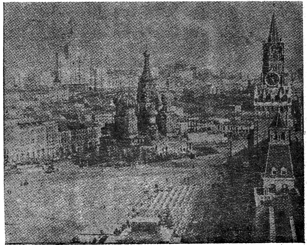
จตุรัสแดงในกำแพงเครมลิน

อภิวางของไอ้คนนี้ได้แสดง คติที่ ประมุข สมาคม บรรดาวิชาการหนังสือพิมพ์ของสหรัฐ ไอ้ค้อ ให้มา เล่น กอล์ฟ จัก (มีต่อหน้า ๑๒)