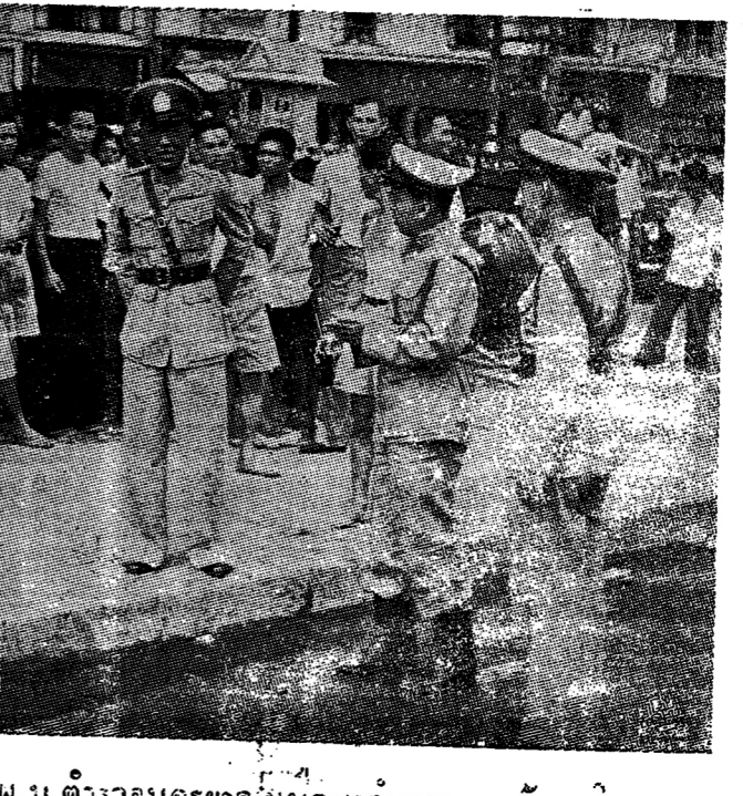
บรรดือ เรื่องพระภุมม, บ.ตำรวจนครบาลหน่อมมาอี นวกราดิ...

นางเอกดิเกสาว ได้แสดง ขบถ ทดงกล้านอกเวที อย่าง อลังการ แต่แทนที่จะปราบคอมมู นิสต์ กลับช่วยนักเลงกระ ตักสร้อยคอสร้อยหมึก เมื่อวันที่ ๑๖ เดือนนี้ เวลา ประมาณ ๑๓ น. ขณะมีคนกำลัง ปลุกปล้ำกัน ได้เกิดมีการ กระตักสร้อยคอคนชนบนรถ ประจำทางสายมฤตยูกัน - ท้า เถียน คือ นางแล่ม สุข สมบัติ การวาทีก คณะ "กมล ประสานศิลป์" กำลังอุ้ม ก.ช.ณรงค์ อายุ ๒๒ ขวบ บุตร