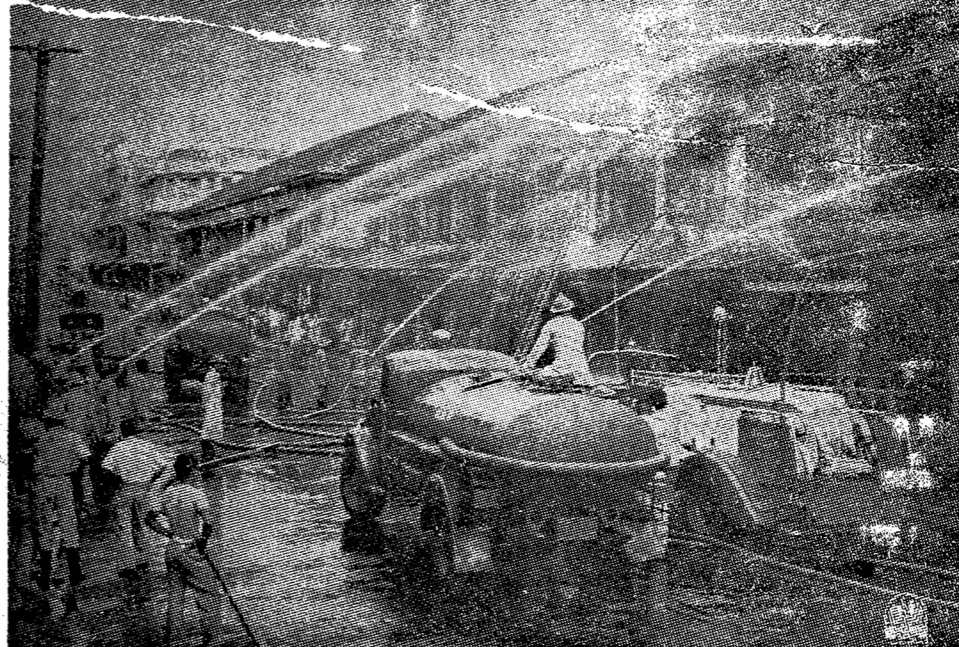
เพ็ญใหม่ที่ร้านพักใช้สามแยกเมื่อวันที่ ๑๖ เม.ษ.

และต่อจาก หนองปลาดุก ไปสู่พรรณ กระทรวงคมนาคม เสนอแนวการ เจริญ โครงการเดินรถไฟ ประ หว่างประเทศไทยกับ ประเทศกัมพูชา โดย ขอใช้สถานี อรัญญ ประเทศเป็น สถานี ร่วมชั่วคราว จนกว่า จะสร้างสถานี ร่วม (มีต่อหน้า ๑๒)