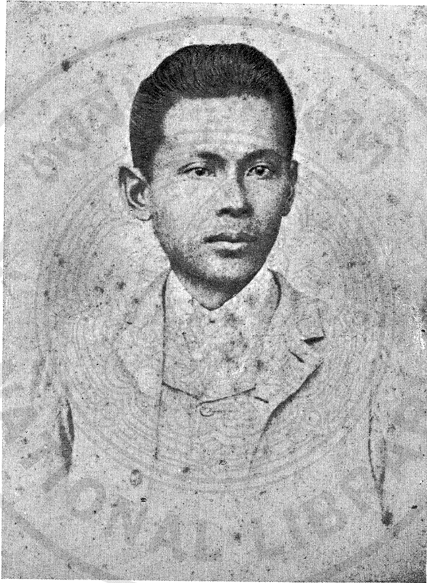
เมื่อเป็นหลวงราชดุรรัักษ์ อายุ ๒๔ ปี