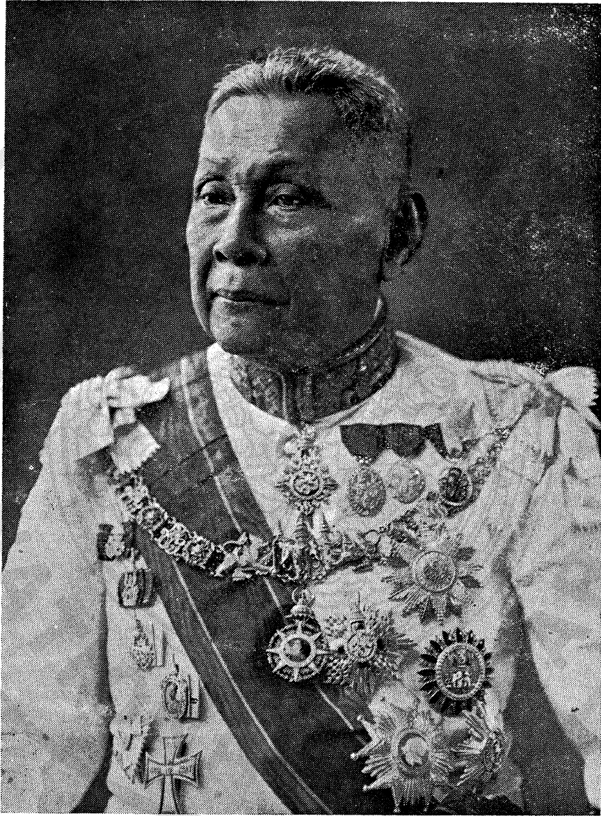
เมื่อเป็นเจ้าพระยาวรพงศ์พิพัฒน์ อายุ ๘๐ ปี