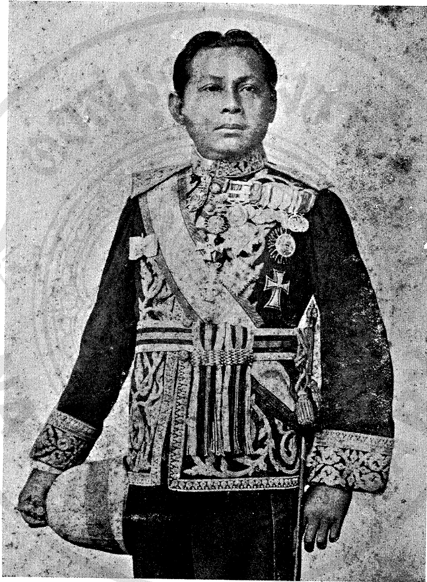
เมื่อเป็นพระยารพงศ์พิพัฒน์ อายุ ๔๑ ปี