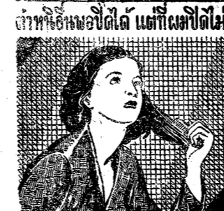
ไอศุกทำสัญญาฉบับ แต่ที่เผอิญไม่ได้