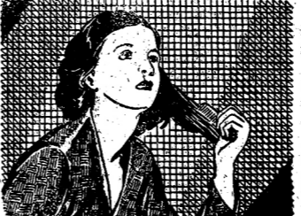
ปลายนมแตก, หมมแดง...