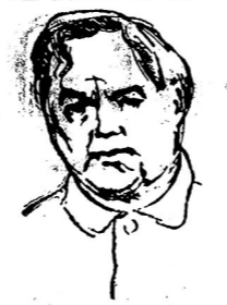
มาเลนคอฟ

เป็นนายกรัฐมนตรีแล้ว สตาลินจึงพาโมโลตอฟเข้าทำงานในหนังสือพิมพ์ ปรอฟคาอันเป็นหนังสือพิมพ์ของพรรคปฏิวัติ คอมมิวนิสต์ของโซเวียต เป็นพรรคคอมมิวนิสต์ของหนังสือพิมพ์ของพรรคปฏิวัติ ๑๙๑๖ โมโลตอฟ ก็เข้าเป็นสมาชิกของคอมมิวนิสต์กลาง