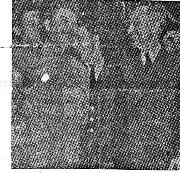
นายพลเรือเอก... (Caption for the group photo.)

นายพลเรือเอก... (Text mentions a thirteenth naval officer.)