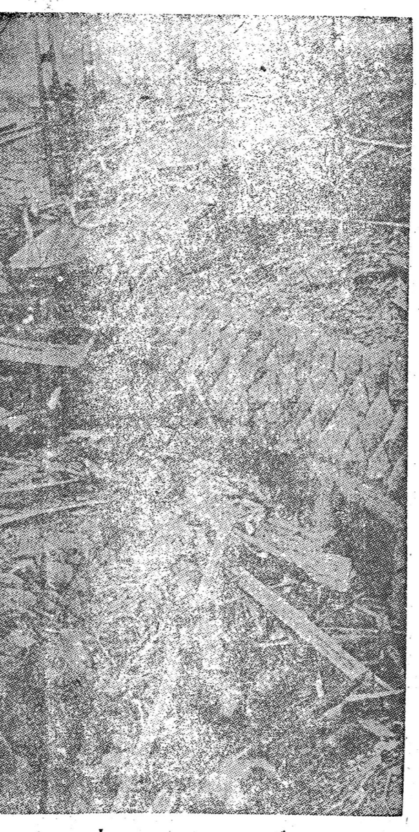
ระเบิดปรมาณู... (Caption for the aerial photo.)

นายพลเรือเอก... (Text continues the narrative.)