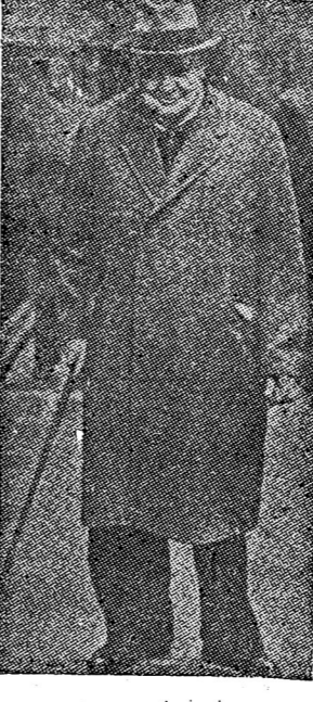
นายพลเรือเอก... (Caption for the portrait.)

นายพลเรือเอก... (Text mentions an eighteenth naval officer.)