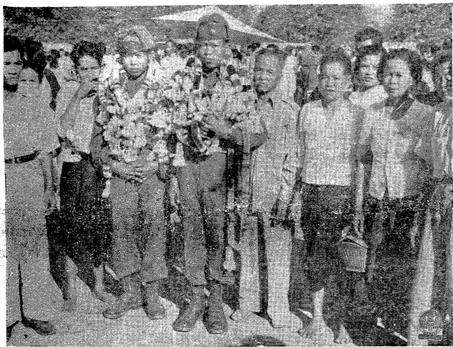
ภาพได้จากการไปส่งหาไทยในเกาหลีเมื่อวันที่ ๑๒ ม.ค. ๕๖

ปีที่ ๑ ฉบับที่ ๔๔ วัน พุธ ที่ ๑๔ มกราคม พ.ศ. ๒๔๙๖ ๑ ข.