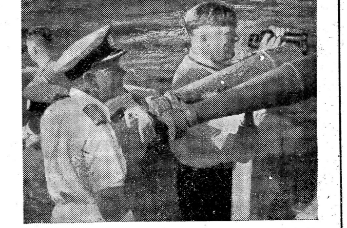
นี่คือการทดลองระเบิดปรมาณูครั้งแรก ของอังกฤษ ภาพบนนี้นักวิทยาศาสตร์กำลังคนเข้าศึกษาที่ จะระเบิด ภาพล่าง ดูการระเบิดด้วยตาเปล่าข้างนอก การทดลองนี้ทำที่เกาะมอนเตเบลโลวันที่ ๓ ๙-๕๒