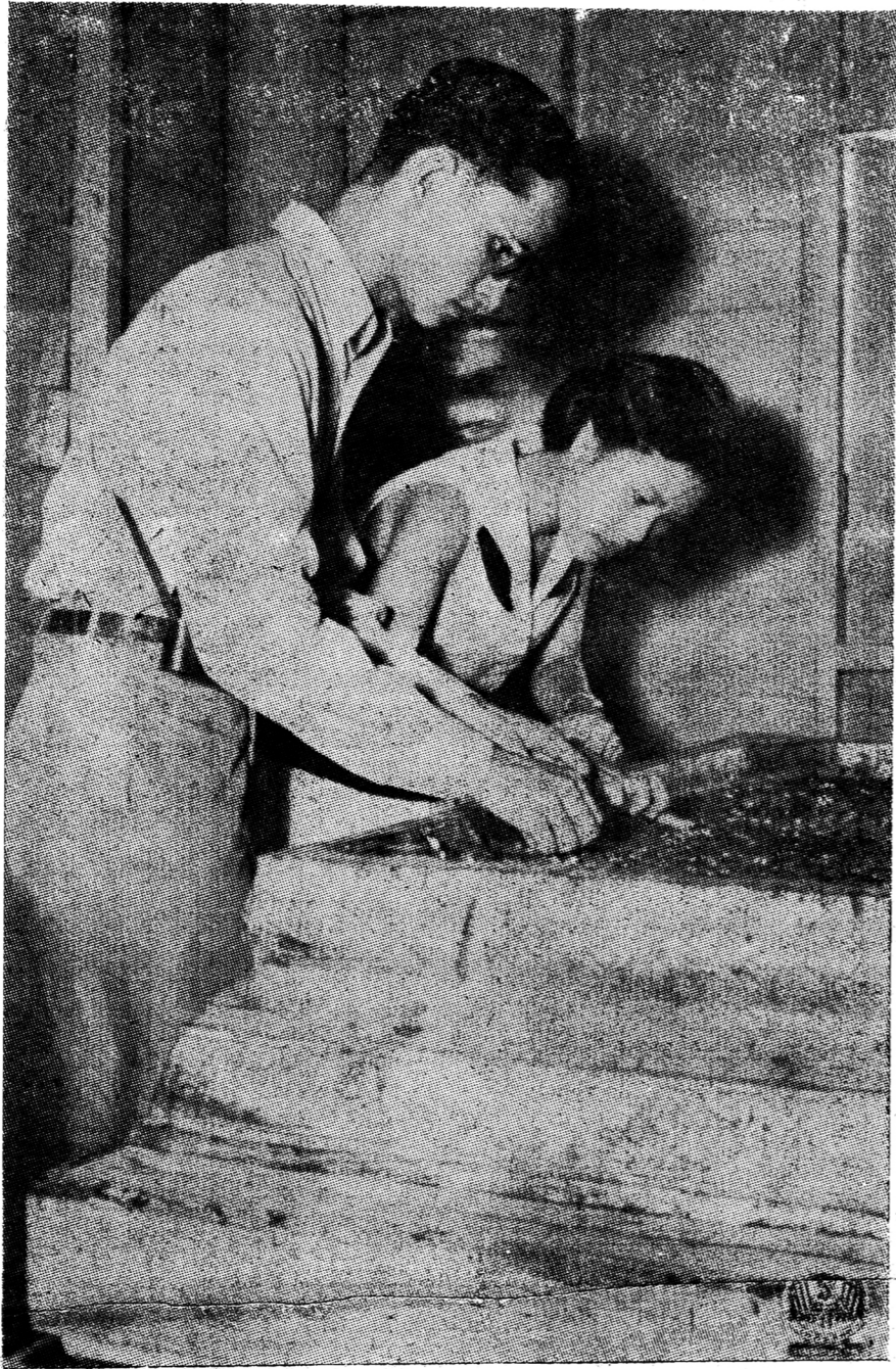
พระบาทสมเด็จพระเจ้าอยู่หัวและพระนางเจ้าพระบรมราชินี เสด็จพระราชดำเนินไปชดถอง ทวยพระพุทธรูปที่วัดป่าเลไลยก์ จังหวัดสุพรรณบุรี เมื่อวันที่ ๑๓ เดือน

พ่อค้าที่ค้ากำไรเงินปอนด์ จะต้องขาดทุนย่อยยับ