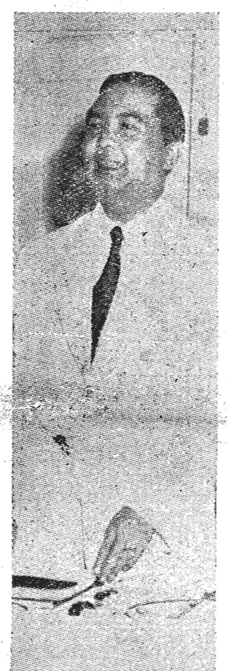
กรมหมื่นนราธิวาสราชนครินทร์