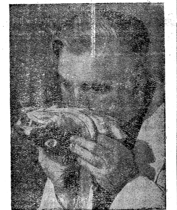
วรัญชานเนอปลา... (Caption for the portrait of a man)

ชาวจากพม่า... (Report on Swiss opposition and international relations)