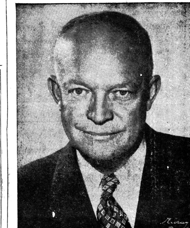
ไอ้เซนเฮอว์เป็นประธานาธิบดีแล้วมีความ