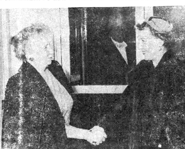
เมื่อคุณนายทรูแมน ภายหลังชัยชนะ)จับมือสวัสดีกับคุณนายไอเซนเฮอว์ที่ท่าเรือขาว