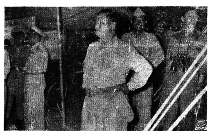
พลเอก สฤษดิ์ ชนระชาติผู้อำนวยการการซ้อมรบทหารที่สระบุรี

ข้าหลวงอปรมาข้าราชการประชาชน อย่าเชื่อข่าวลือให้มันใจคณะรัฐบาล ผู้สื่อข่าวพิเศษประจำจังหวัดลำปางรายงานว่า ผู้ว่าราชการภาคใต้อบรมข้าราชการจังหวัดลำปาง ตามนโยบายของกระทรวงมหาดไทย แต่กลับเกิดข่าวลือขึ้นว่าจะอพยพทำการรัฐบาล และประชาชนออกนอกเขตเทศบาลโดยด่วน ร้องถึงข่าวของในศาลาแดงขึ้นในทันทีทันใด แต่ทั้งนี้และทั้งนั้นเนื่องมาจากการประชุมอบรมอย่างเอาจริง เอาใจ ของท่านผู้ว่าราชการภาคใต้เอง