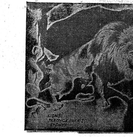
สิงห์โตในสวนสัตว์ประเทศออสเตรเลีย