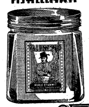
ครีมแต่งผม VALENTINO