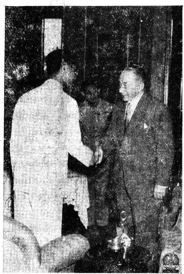
พระบาทสมเด็จพระเจ้าอยู่หัวเสด็จออก ทรงต้อนรับนายบอเลเรโนคอดีตนายกรัฐมนตรีแห่งประเทศฝรั่งเศส ณ พระที่นั่งอัมพรสถาน ๑๖ มีนาคม

ในการเสด็จแปรพระราชฐานครั้งนี้ รัชชูปการตามวังหัวหินได้จัดไว้เป็นอย่างดี และเพิ่มเติมกำลังเพื่อรักษาความปลอดภัยให้เป็นการเข้มแข็งยิ่งขึ้นอีกด้วย