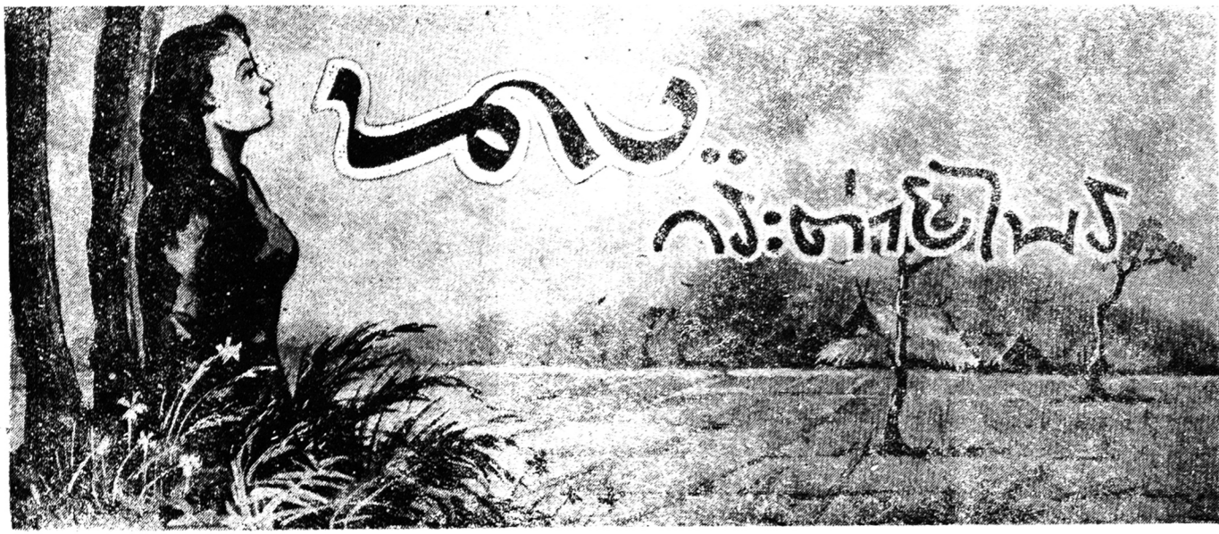
(ต่อจากฉบับก่อน)

อ้อมอกพระทัยมาก ทุกคน ภายในวัง ชาววัง เห็น ร้อนในการจากไปของกระทาย เข้ามาหญิงแก่ถึงกับไม่มีมอง หน้าหญิงเล็ก และไม่ยอม พูดทักทาย แต่หญิงเล็กไม่ รู้สึกใดในเรื่องนี้ เห็น การที่ เสียดูยชากับกระทายเข้ากัน ความรักและความเอา ออกจาก ใจของคนที่หลายจะ ใด พังมา ยังหญิงเล็กแต่ก็โดยไม่ได้ ถูกแย่งแยก และหญิงเล็กก็ คงจะ เป็นเด็ก ที่สับสน เกือบ เสียวอกและ เสียวใจ แม่ ระวัง ความใจงั้นควรวาง แต่เมื่อชายที่คอยบงกชทอง มาถึง ใจก็สับสนเรื่อง รว ทาง ๆ ซึ่งพอสรุปความได้ว่า สาเหตุที่มวลคนเกิดจากหญิง เล็กคนเดียวเท่านั้น ชายที่คอย ระวังถามเอา ความ ระวัง จาก หญิงเล็กว่า “น้องเล็ก เธอหรือเปล่า ว่า เธอทำให้พ่อของเธอสวย เสียใจมาก” หญิงเล็กก็ตอบ อ้อมแอ้มว่า “เปล่าค่ะ” “เล็กไม่ควร พวกา เปล่า แต่ที่จริงเล็กก็ รู้สึกดีกว่า รู้สึกอก คนอื่นที่รักเด็กเล็ก ที่แก่ทักทายหมกแล้วใหม่ เสีย แรงที่คนรักเด็กมาก แต่เด็ก ไม่ได้ทำให้ คนที่รัก เด็กเสีย ใจเลย เล็กก็รู้ว่าชาย เป็น หลานของนาง ซึ่ง คนรัก มาก แต่ถ้าจะเทียบกับความรักที่คน มีต่อเด็กแล้ว ฝักฝักมากนัก ชายเพียง หลาน แต่ ก็ ไม่ใช่ หลานที่แท้จริง ส่วนเล็กเป็น น้องของนาง ร่วมสายโลหิต อันเดียวกัน ก็ใครเล่าจะ รักคนนอกเท่าที่รักน้องรวมทั้ง เด็กด้วยกัน การกระทำของเล็ก ที่แล้ว ๆ มานี้ มันทำให้คน เสียใจมาก — เสียใจ อย่าง ออกไม่ถูกทำไมเล็กจึงหัน — เสียใจคนเห็นแก่ตัวมากอย่าง นี้ เพียงแต่ทักทายมา อาก็ยอม และทักทายด้วยความ เห็น ความ ทุก ๆ คนยังเท่านั้น ไร้ เหล่านี้ มี ก็ ทำลาย ความ สุข