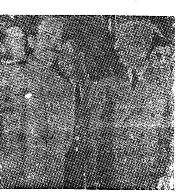
รอยจารึกระหว่างสหเสถิน กับทรูแมน ที่ปอร์สละตี

【ต่อจากหน้า】 ในยามราตรี เรือยอมนแดน เดียม ตาม ชายฝั่ง แอตแลนติก อังโกลมาจะไม่มีแสงไฟ แต่ ก็ผ่านไปไม่ช้าทาง ของเรือคานา ทากองจอดครออยู่แต่ แสง ไฟส่องสว่างของ ชายฝั่ง ยอมน เดียม แสง มายแรงที่ แอตแลนติก นน เพียงเท่านี้ก็เพียงพอ แลดู มอรัสนัยงานงานไวอก ภา