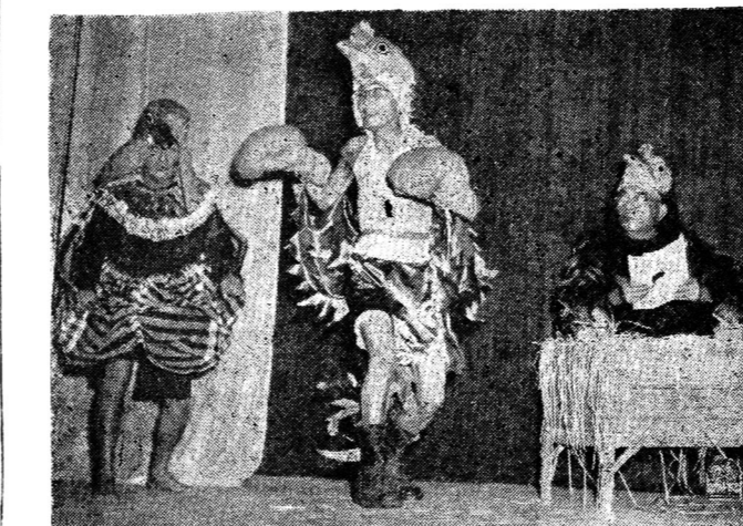
พระลตตามโก อัครราชทูตของงานวันเวียง ๑๐. ย. เอ.

๙.) ได้พิจารณาและอนุมัติโครงการส่งเคราะห์ทหารผ่านศึก นอก ประจำ การ ประจำปี ๒๕๖๖ ในจำนวนเงินที่ได้รับอุดหนุนจากรัฐบาลเป็นเงิน ๕,๐๐๐,๐๐๐ บาท สำหรับอุดหนุน อุปการะทหารผ่านศึกนอกประจำการ และครอบครัว