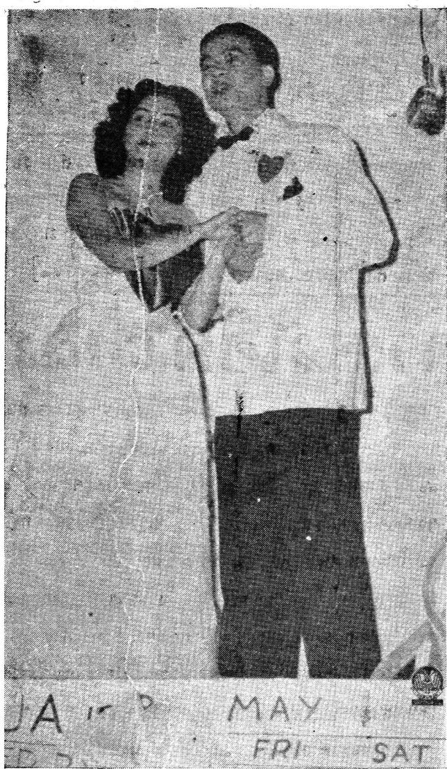
คววณเพลงหน้าไมโครโฟน จากงานวันเรียงของ เอ.ยู.เอ. ที่วังสราญรมย์