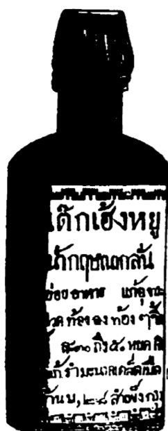
เกียรติคุณ ของ ยา