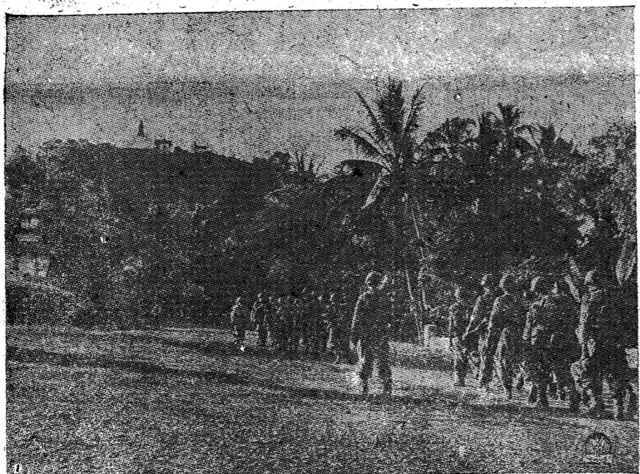
ทหารสหภาพฝรั่งเศส ที่ถูกส่งเข้ามาเสริมกำลังของกองทัพหลวงพระบาง ภาพข้างหลังที่ไกลออกไป คือภูเขาสูง ซึ่งเมื่อก่อนคือ สหภาพ เช่นที่เมืองของชาวเมือง

ปีที่ ๑ ฉบับที่ ๑๕๐ วันเสาร์ที่ ๒๓ พฤษภาคม พ.ศ. ๒๔๘๖