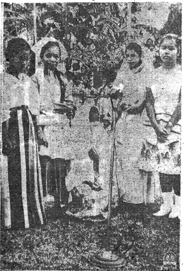
ลูกเสือหญิงของฟิลิปปินส์แสดงวงร่ำเล็กถึงอุดมคติแห่งสันติสุข และมีตราภาพสากลเด็กหญิงฟิลิปปินส์ได้ส่งคำอวยพรและของขวัญไปให้ลูกเสือหญิงทั่วโลก ลูกเสือหญิงเหล่านี้แต่งเครื่องแบบ(จากซ้าย)ของฟิลิปปินส์ เนเธอร์แลนด์ ปากีสถาน อินเดีย และนอร์เวย์