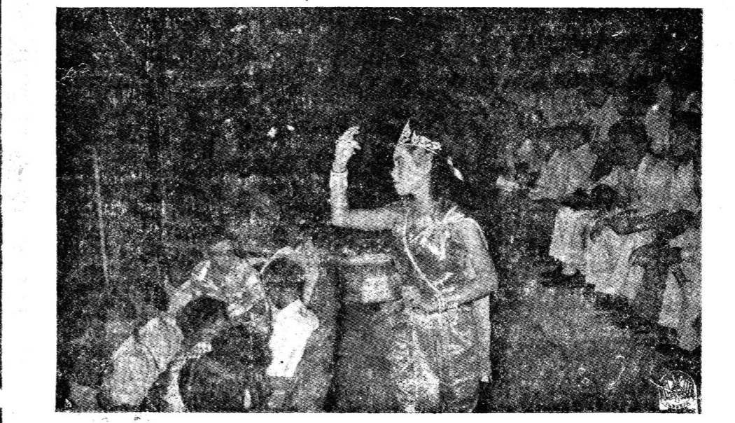
สาวงามกำลังไปขอตอกไม้งานเปิดโรงภาพยนตร์แกรนด์ไฮเตอร์ที่วังบูรพา