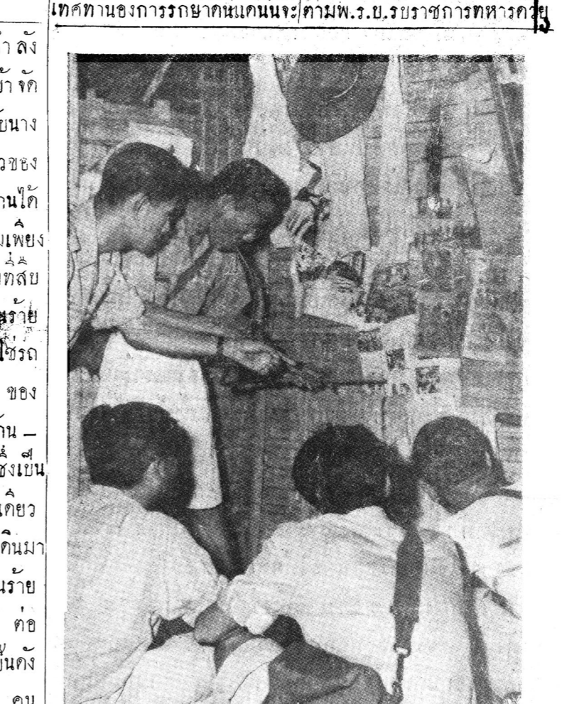
นักเรียนจับยุงจากห้องนอน ในบ้านหลังหนึ่งเพื่อนำไปทดสอบในห้องทดลองเพื่อปราบ ไข้มาลาเลีย.

คณะรัฐมนตรีได้มอบหมายให้กรมรักษาดินแดนพิจารณาหลักสูตร และวิธีการสำหรับจะอบรมนักเรียนให้มีความรู้ในการป้องกันประเทศ ทำนองการรักษาดินแดนของปรมาจารย์อังกฤษ ทั้งนี้ เพื่อที่จะได้เสนอให้พิจารณาให้มีการยกเว้นเข้ารับราชการทหาร ในเมื่อถูกเรียกเกณฑ์ด้วยหรือถ้าได้สำเร็จก็ยกเว้นตามหลักสูตร ก็คงจะได้รับการยกเว้น ไม่ต้องเรียกเกณฑ์ เข้าฝึก ราชการ ทหาร