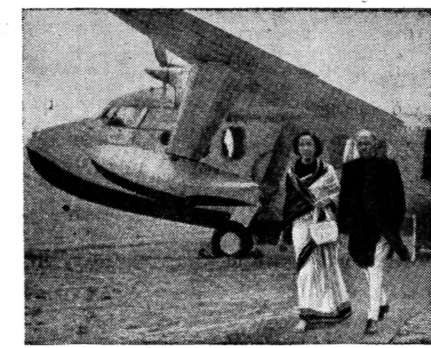
เครื่องบินสี่ที่นั่งสี่ที่นั่งของกองทัพเรืออินเดีย

ตั้งฉายาเจตนาฆ่า เพื่อปิดปาก ตั้งฉายาเจตนาฆ่า เพื่อปิดปาก