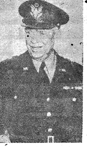
โจเซฟ... สหรัฐอเมริกา