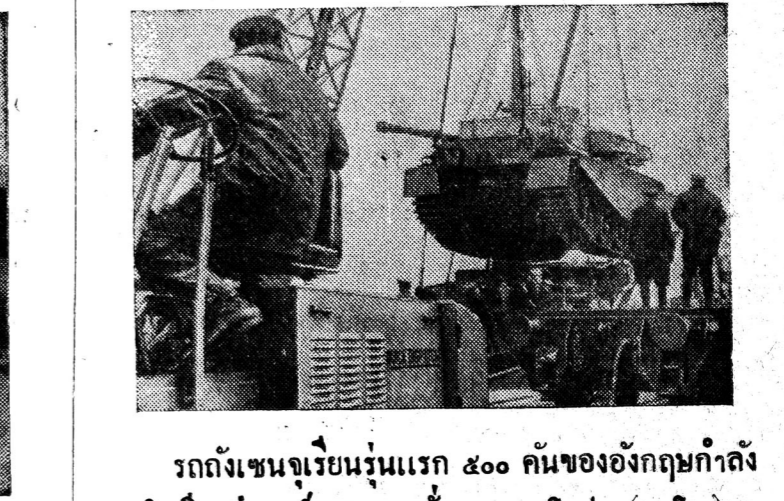
รถถังเชนจ์เรียนรุ่นแรก ๕๐๐ คันของอังกฤษกำลังถูกลำเลียงส่งองค์การความมั่นคงของยุโรป (นาโต)

ชาวนาขอผ่อนผันตั้งข้าวข้ามเขตต์ เพราะความเดือดร้อนจากถูกกดราคา ชาวนาขอผ่อนผันตั้งข้าวข้ามเขตต์ เพราะความเดือดร้อนจากถูกกดราคา