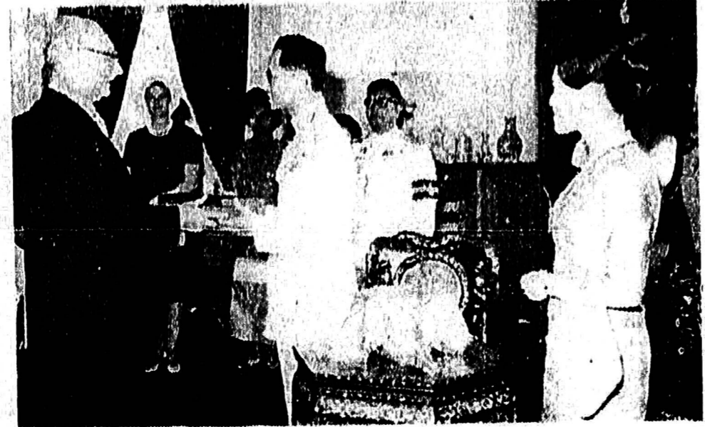
เมื่อ วันที่ 17 มี.ค. 1967... [ภาพทนายความ]

การที่เงินดอลลาร์ที่เข้ามาในประเทศไทย มีมูลค่าของเงินบาทต่ำกว่าอัตราแลกเปลี่ยนนี้ แสดงให้เห็นชัดว่า จำนวนเงินดอลลาร์ที่เข้ามาประเทศไทยมีจำนวนมากถึงขั้นที่จะกระทบกระเทือน ที่จะทำให้ราคาของในท้องตลาดสูงขึ้น คือทำให้กำลังซื้อของเงินบาทภายในประเทศต่ำลงไปด้วย เป็นผลกระทบค่าเงินสองสกุลถูกใช้ในที่สุดเมื่อใด ย่อมมีกำลังซื้อทำให้ค่าของเงินบาทต่ำลงด้วยกัน ถ้าเงินบาทสองสกุลจะสมรสกันกลายเป็นสกุลเดียวกันก็ได้ เรื่องเงินดอลลาร์ที่ทหารสหรัฐนำเข้ามาใช้ในประเทศไทย จึงเป็นเรื่องน่าสนใจที่จะหาทางป้องกันควบคุมให้ถูกร้อยต่อร้อยเท่านั้น ไทยจะต้องร่วมก่อตั้งผู้กรรมาทอนไปอีกนาน การจัดในเรื่องนี้อาจเป็นเรื่องจำเป็นที่จะต้องหารือกันจนกว่าจะพอใจเพราะเรื่องสำคัญอย่างนี้ เช่น การพิจารณาว่า เงินดอลลาร์ที่เข้ามาประเทศไทย ควรแลกเปลี่ยนเป็นเงินบาทเสียก่อนตามอัตราแลกเปลี่ยนที่กำหนด แล้วจึงจ่ายให้ทหารนำไปใช้ เมื่อสงครามโลกทั่วแล้วมา ไทยเองที่มีอัตราเงินเฟ้อขึ้นสูงมาก กล่าวกันว่ามีคนอื่นช่วยพิมพ์ดีดเหมือนกัน ก็ด้วยเหตุวามละ 8 ศตวรรษจึงไม่มีขายงานฉบับนี้ การจัดการเงินโดยเฉพาะสำหรับใช้ในวงการของทหาร ตามความจำเป็นนั้น น่าจะได้มีการเตรียมไว้ควบคุมเสียแต่เนิ่น ๆ โดยเฉพาะเงินดอลลาร์ ที่ทหารสหรัฐนำมาใช้ในประเทศไทยทุกวันนี้ ก็ควรมีวิธีการที่ควบคุมจำนวนให้รู้แน่ชัด □ □