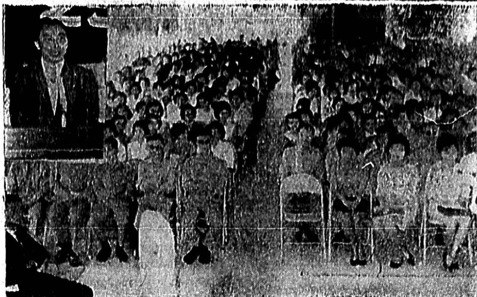
ประชาชนที่มาร่วมประชุมที่ศาลากลางจังหวัดเพชรบุรี