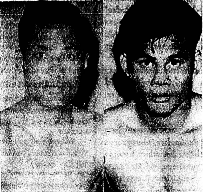
ศรกีกรพบเพชรทอง ในเจ้าวังเวียน 10'

เพราะว่าเมื่อ 10 วันก่อนเวลา 10.00 น. ของที่ทำการตลาด และสหภาพไปรษณีย์ ตลาด วังเวียน 10' ประจำเดือน มกราคม อย่างเช่นนี้