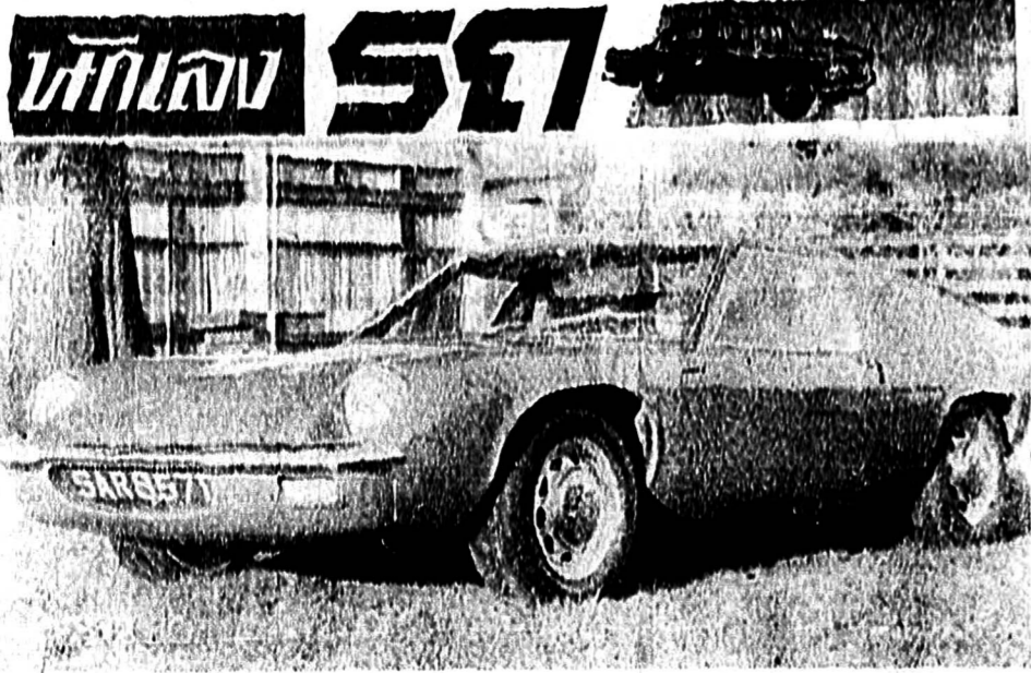
ลอตัส "ยุโรป"