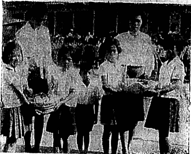
คณะผู้บริหารเทศบาลเมืองเพชรบุรี