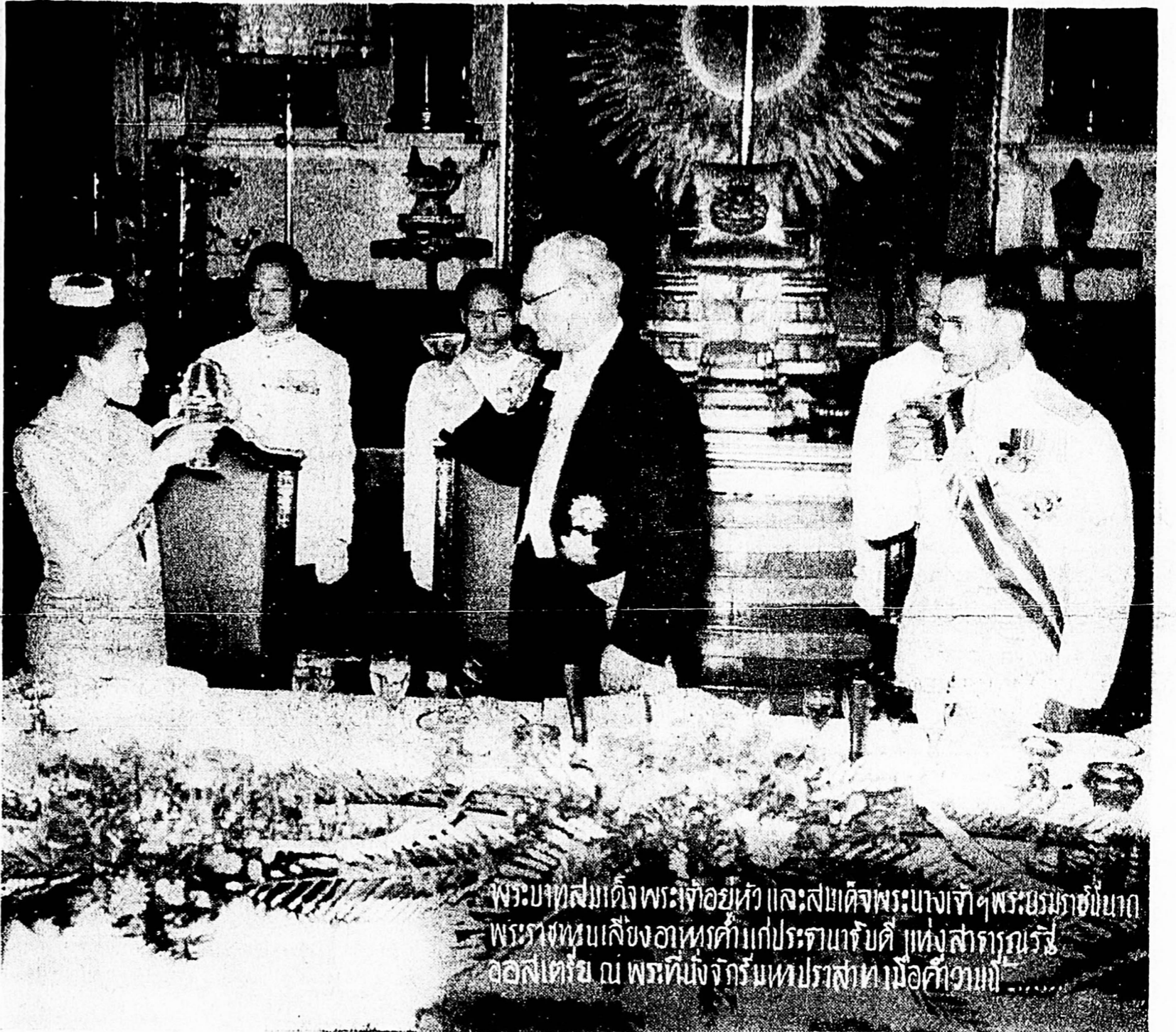
พระบาทสมเด็จพระปรมินทรมหาภูมิพลอดุลยเดช ทรงมอบรางวัลให้แก่ประธานาธิบดี แห่งสาธารณรัฐ ออสเตรีย ณ พลทิมังจักรีนหปรสาทน์เมื่อวันนี้