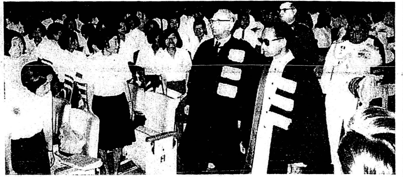
ประธานาธิบดีจอห์น เอฟ. เคนเนดี... [ประธานาธิบดีจอห์น เอฟ. เคนเนดี]

เหตุผลควบคุมเงินตรา ในการให้สัมภาษณ์เมื่อเช้าวานนี้ รัฐมนตรีคลังได้กล่าวถึงการพิจารณารัฐบาลเกี่ยวกับการให้เงินดอลลาร์ในตลาด ซึ่งจะช่วยให้ค่าของเงินบาทอ่อนลง เพราะคนนิยมใช้ดอลลาร์แทน ควรจะมีมาตรการควบคุมอย่างอื่น ไม่ใช่ให้ทหารอเมริกันใช้ดอลลาร์แทนเงินไทย โดยขอขอร้องให้ทหารสหรัฐจ่ายเงินเดือนให้แก่ทหารเป็นเงินบาท รัฐมนตรีคลังกล่าวว่า เรื่องการควบคุมเงินตรา ต่างประเทศก็มีเหตุผลที่จะต้องอธิบายกันมาก "บางประเทศควบคุมเงินตราต่างประเทศ และการควบคุม"