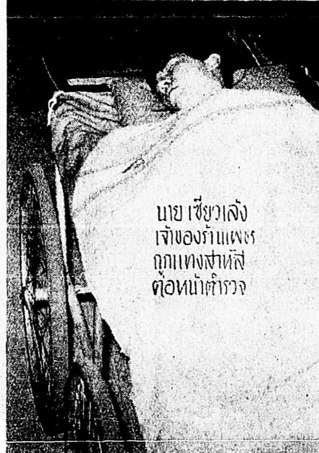
นาย เขียวจั่ง เจ้าของร้านเพชร ถูกแทงสาหัส ต่อหน้าตำรวจ

เจ้าหน้าทีมตำรวจควบคุมตัวถูกสะโภทนต์รี เจ้าของ ห้องตันเพลิงซึ่งมีเกิดเหตุ เนื่องมากรลักฐานเสนาหตุของ เพลิงไหม้ หน่วยบรรเทาทุกข์ของทางราชการกับ มูลนิธิธราประชาชนเคราะห์โง □ อ่านต่อหน้า 2