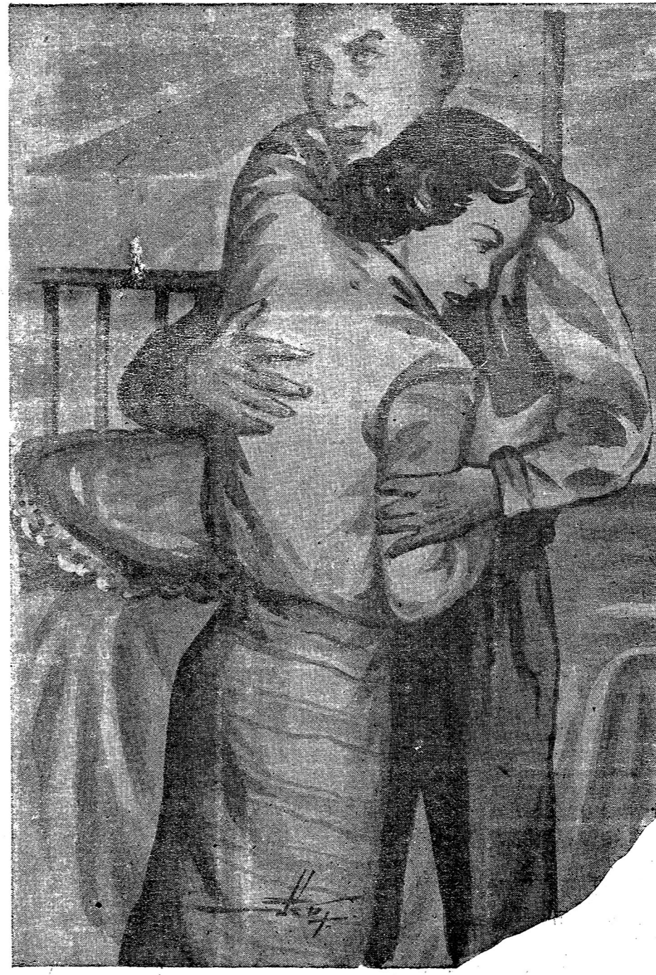
มีหน้าที่เขาพอจะรักกันหรือไม่ก็... เสียใจจนร้องไห้ตั้งท้องมาจากบึงลำ

กลบลูโทษ เมื่อเสร็จคดี ทาง จัง หัก... ดำบ้างแล้วจำเนาะคงต้อง