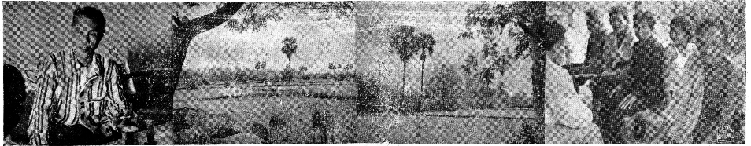
พระราชพิธีราชาภิเษก "กิมเลียงตองใหญ่ที่วังศาล แต่สมุทรมงคลมั่งคั่งพระราชญาติ" ส่วนหนึ่งของผืนนาอันไพศาล ในจำนวนสองแสนไร่ของหลวงสิทธิ ราชวพัฒนาท่ามะกา แอ่อยู่ได้แยกนายทูนที่ไม่วัดมาเลย

สาวกล่าวหา พันโทไสยา ปลุกกำหนดตัวกลับเป็นจำเลย