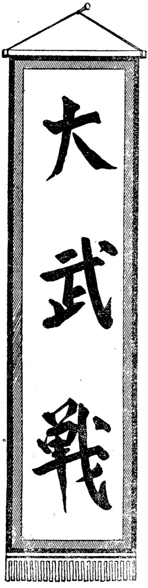
(ต่อจากหน้าพฤหัสบดี)

เขยโหมหน้าหมอนเมื่อใดยอมเป็น ศึกใหญ่หลวงเกินกว่าที่ ได้ผ่าน พมมาแต่ทั้งในคาเชยและคา- เรงเมย กำลังของชาวอิสลาม ซึ่งเป็นจำนวนอัน กอบ ด้วย- ทหารมาก สมแข็งมีอาวุธอย่าง พร้อมทั้งเครื่องรบของเขา ประ- ทับกองทัพมองโกลทุก ชนะ หากว่าชาวอิสลามมีชายคนผู้ ที่กล้าหาญ ประกอบทั้งกำลัง รวมของชาวอิสลาม ก็อยู่กระ- ฉับกระฉวยตามดินแดน ต่าง ๆ มีถึงตั้งอาณาจักรซึ่ง เป็น วงศ์ต่อมองโกลอยู่รอบ ทิศ ในขณะกองทัพมองโกล มีกำลังอยู่เพียงแต่เศษเท่านั้น มีหน้าชา อิดคัทแห่งเอเธนส์ และออลมาดซึ่งได้กราบทุก ดา พระ องค์ ถ่อม เมือง เพราะ ได้ รอนแรมมาช่วยออกศึกหลายปี แล้วพระองค์ทรงอนุญาต ให้ กลับไปได้พร้อมด้วยกองทัพ ไม่ได้มีสิ่ง บัญชา ของคน ทั้ง ต้อง พระองค์อนุมัติตามใจ ไม่ทรงขัดขวางประการใด อนุ