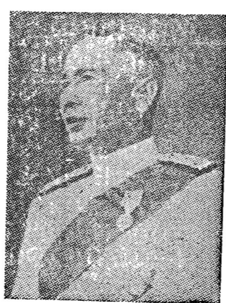
ท่านจอมพลของเร... (Caption text partially obscured)