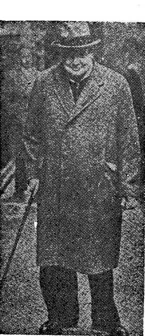
นายกรัฐมนตรี... (Caption text partially obscured)

เดี๋ยว ไปยังรัฐ ภาคของคนที่... (Text continues with commentary on regional politics)