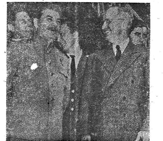
รอยจารึก ระหว่างสถานี... (Caption text partially obscured)

นายกรัฐมนตรี... (Text continues with commentary on government affairs)