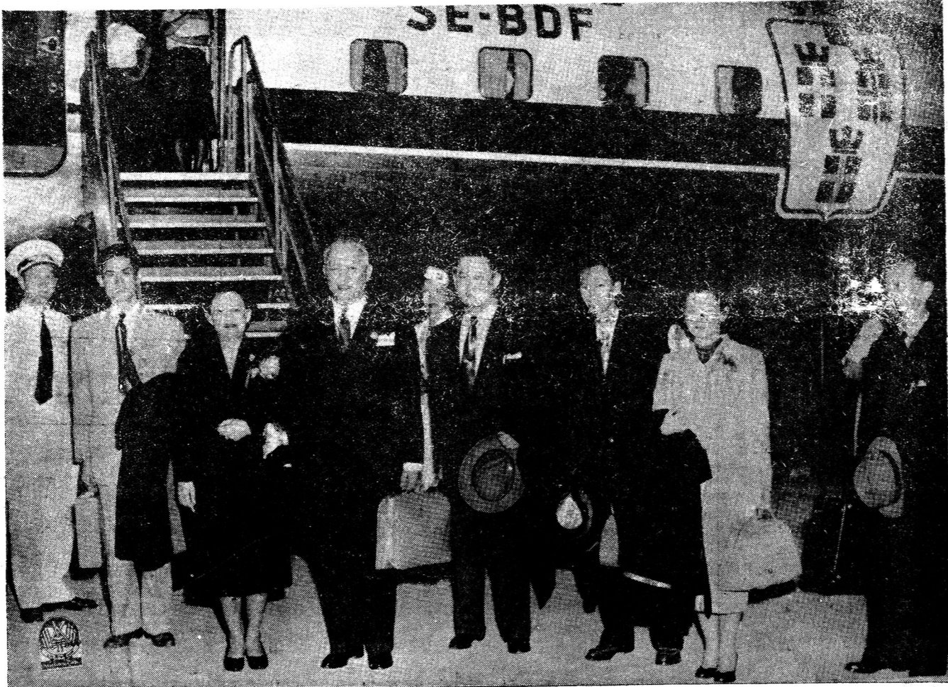
พล ต.อ.เผ่า เหิรฟ้า นนท์ก่อนเดินทางไปประเทศญี่ปุ่น ที่ท่าอากาศยานดอนเมือง