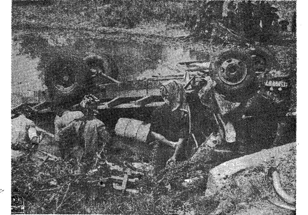
ตายสคนเท่านั้นเอง อุบัติเหตุก่อร้ายหนงบนถนนสายนครปฐม-กรุงเทพฯ ตายสบาทเจ็บอีกมากกรวมทงพระภิกษุออกรูปเมื่อวัน ๑๑ เมษายน