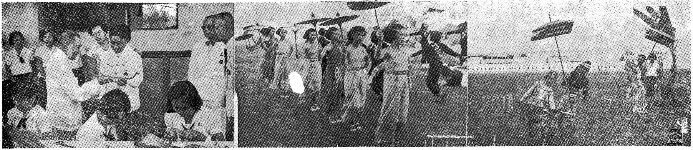
พระวรวงศ์เธอ กรมหมื่นพิทยลาภฯ ประธานองคมนตรีเสด็จทอดพระเนตรการฝีมือและการเล่น เบ็ดเตล็ดของหน่วยนุเคราะห์ของโรงเรียนต่างๆในงานวันนุเคราะห์