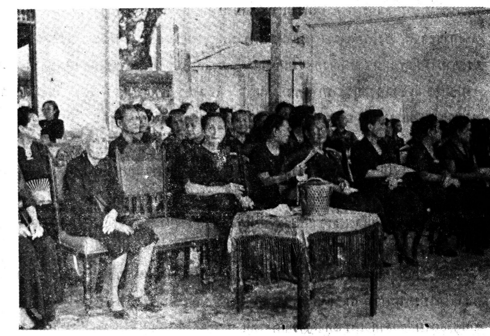
ท่านผู้หญิงละเอียด กับ สุภาพสตรีผู้มีเกียรติ

ซึ่งมีฉายาว่า "หก แรง แข็ง ขัน" ได้ยื่นคำร้องต่อ พล.ต.อ.เผ่า ศรียานนท์ อธิบดีกรมตำรวจและ รัฐมนตรี ช่วยว่าการกระทรวงมหาดไทยว่า ขอให้ทำเนียบการ เพื่อให้มีการแข่งขันการเลือกตั้ง โดยการเสนอธรรม และขอให้ขอแนะนำว่าที่ ไปลง คะแนน ควรจะใช้บัตรประจำตัวของประชาชนไปแสดงประกอบด้วยกับขอให้จัดกิจกรรมการหน่วย ลงคะแนนแบบใหม่ ที่มี ข้อ เสีย และมีความเสรีจริง ๆ