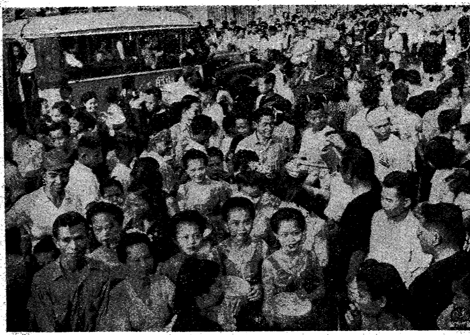
ประชาชนชาวเชียงใหม่มาชุมนุมในวันสงกรานต์

ในหมู่มิตรสหายที่รักใคร่กันมา... สักวันหนึ่งก็ทำการรณรงค์หาเสียงอย่างเข้มแข็งและ