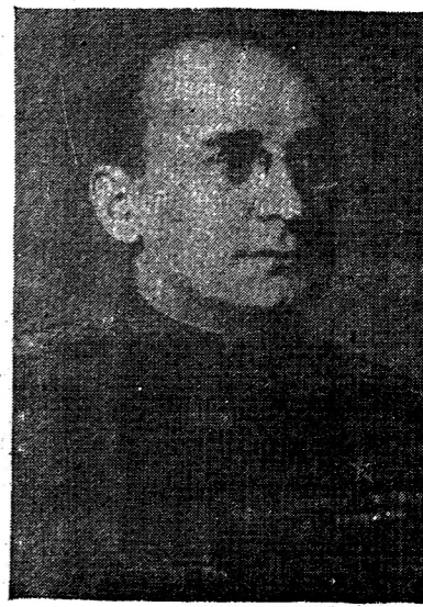
สตาลินผู้ทรงปัญหาให้ชาว ม่านเหล็กขบคิด

ซอสต์อันธังและซอสต์คัย ทั้งเป็นนักพยายามเขาในทุกสิ่งทุกอย่างเสมอ"