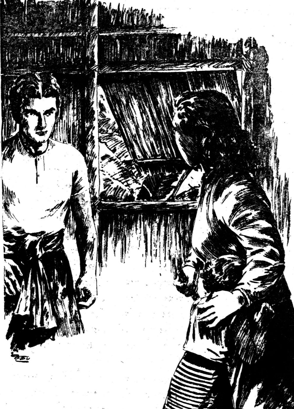
ไฟลพิพย์กับกระต่ายน้อย ทั้งสองคนก็เดินไปหากระต่ายน้อยที่เขมเจ้าไว้ว่า คนจนระคบสันตภัย คนมีมีไม่ได้อะไร โดยไม่รู้ถึงเหตุ ผลอย่างอื่น ที่ ลุง ทอง แด ไม่อยากให้อายุคือ เกรงจะ ไปพบ กับเขมเจ้า เขมเจ้าเรื่องระพลอย มีเรื่องไม่เกิดขึ้น เขมเจ้าว่า ทางๆนั้น เป็น เชิง คุก และ หยาบมาหนักเกินไปแล้ว ครั้นไฟรนพบกระต่ายน้อย ก็เอ่ยชวนอีก กระต่ายน้อยก็ตอบว่า

ไฟลพิพย์กับกระต่ายน้อย ทั้งสองคนก็เดินไปหากระต่ายน้อยที่เขมเจ้าไว้ว่า คนจนระคบสันตภัย คนมีมีไม่ได้อะไร โดยไม่รู้ถึงเหตุ ผลอย่างอื่น ที่ ลุง ทอง แด ไม่อยากให้อายุคือ เกรงจะ ไปพบ กับเขมเจ้า เขมเจ้าเรื่องระพลอย มีเรื่องไม่เกิดขึ้น เขมเจ้าว่า ทางๆนั้น เป็น เชิง คุก และ หยาบมาหนักเกินไปแล้ว ครั้นไฟรนพบกระต่ายน้อย ก็เอ่ยชวนอีก กระต่ายน้อยก็ตอบว่า “พอแยกตัวจาก จัน จึง ไม่ยอมให้ตายไป” “ฉันไม่หิวอะไรเลย นะตาย ของทางๆก็เป็นของพองทั้งนั้น” ไฟรนพยักพาด “ตายก็ไม่รู้ พอยจนไม่ให้ ตายไป ตายก็ไม่ไป” พก แลวงวงหนีไปเล่นทางอื่นโดยไม่เอาใจใส่คือ ไฟรนอีก ไฟรน เป็นเด็กซำคึก เมื่อมีเหตุ อะไรใหม่ๆเกิด ขึ้น มัก จะ เกือบ มาคึกเสมอ เขาพึ่งรู้เคยวัน เองว่าคนมีจะระคบ กับ คนจน ไม่ได้ คั้นนกระ ต่ายน้อย จึง ไม่มี โอกาสจะไป เทียว บ้านไฟรน จนกระทั่งไฟรน เรือน ชัยชนะ ประถมปีที่ ๓ เขมบอกว่าจะส่ง ไปอยู่ยอญถาถองเทพ เพื่อ เรียนต่อที่นั่น ก่อนจะไปถองเทพ ไฟรน ได้มาหาไฟลพิพย์และภานาสนม มาฝากไฟลพิพย์ด้วย แม่ ไฟลพิพย์จะเห็นเด็กที่อดทนอดกลั้น เขาไม่ได้อะไรเลย ลูกของไฟรนน้อยใจ ในใจ ถ้าหาก นำไปขายของเขา เหมือน ลูกชายแล้ว เขมจะเป็น คนที่ นานักมาก การที่ไฟรนไปมา หาฝากไฟลพิพย์ น เขม ไม่รู้เรื่องเลย เพราะ ไฟรนไม่ได้ออกให้รู้ เมื่อ ไฟรนจาก ไป แล้วไฟลพิพย์ก็ซำคึก คน เขาใจใส่ ถ้าหากพวกเจ้าวันซึ่งจะ เลื่อนไปเรียนชั้น ประถมปีที่ ๓ มารั้งไฟลพิพย์ระคบ สัก คน เขมว่า แต่การที่ไฟลพิพย์มีพร่างไฟลพิพย์ว่า เขม จึง ทำให้ พวกเจ้าวัน ความ อยู่ เพราะ