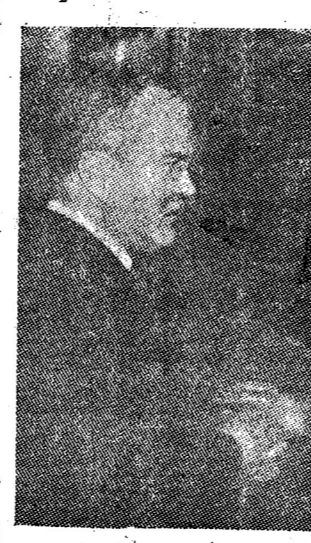
นอ โมโลตอฟ

ทุกวันนี้พรรคการเมืองหลายแห่งต่าง แสดงความเสียใจต่อสตาลินผู้ยิ่งใหญ่แห่งสหภาพโซเวียต ชาวจากกรุงเม็กซิโกต่างบอกว่า "นั่นเสียงของรัฐบาลโซเวียตในคืนที่สตาลินป่วยเสียใจ เพราะชาวโซเวียตถือว่า สตาลินเป็นผู้รักและศรัทธาคนสันนิบาตโลก โดยเฉพาะกับคอปโซเวียตเองโดยมากกว่าเพื่อน