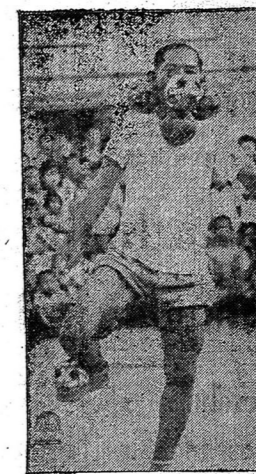
นักตะกร้อ แสดงในงานพระบาท วัดจักรวรรดิราชาวาส (วัดสามปลื้ม)