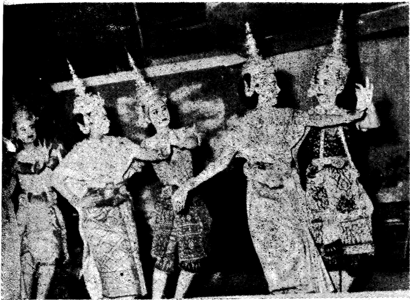
ระยารามฯ แดง ผลงาน ของ เทศบาล