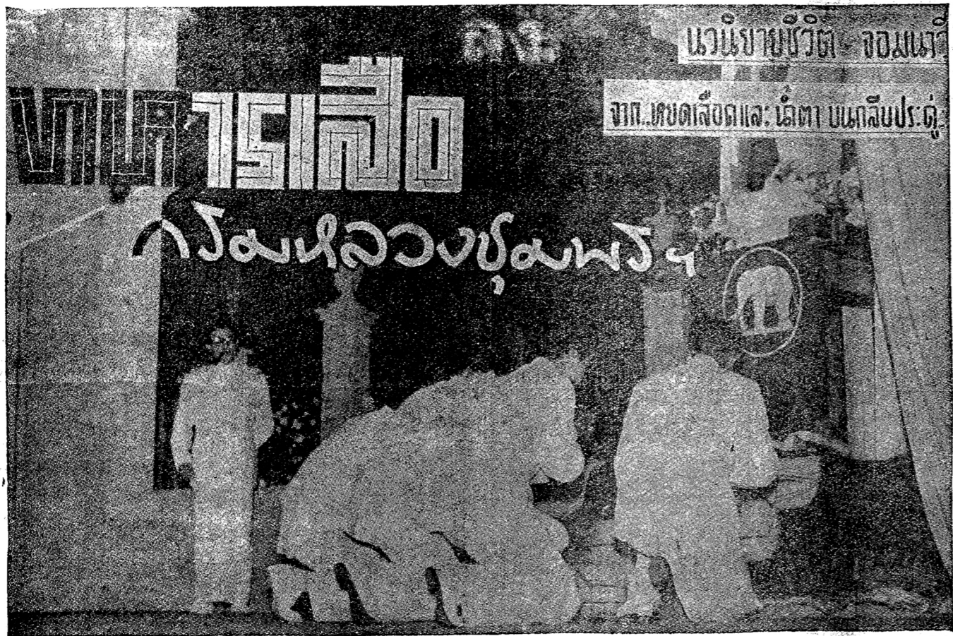
(ต่อจากฉบับก่อน)