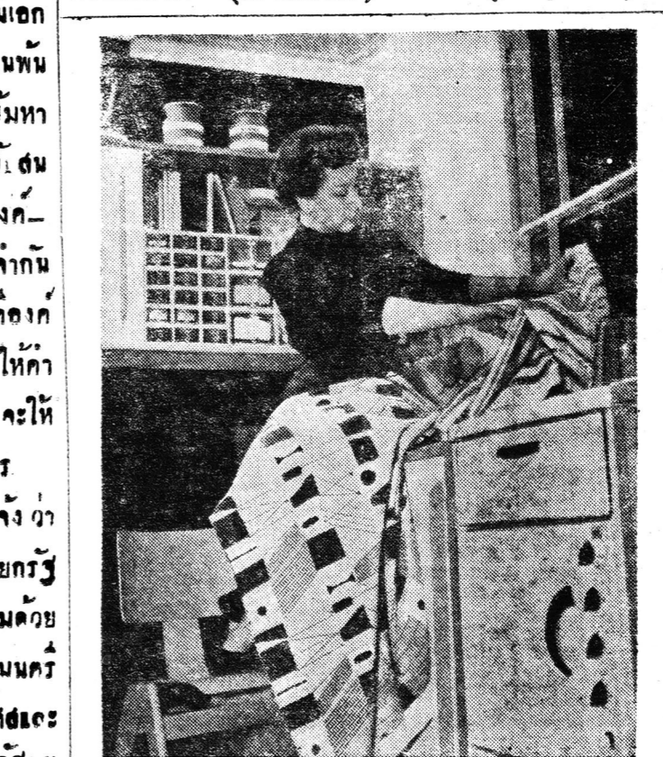
ผู้ชนะการต่อสู้แบบใหม่คือภาษาอังกฤษ มีที่ถกถกกันนอกจากที่ใดก็ได้แล้ว ยังมี ลวดลายใหม่ๆ ที่ยังไม่อาจจะหาได้ ผู้ประพันธ์เรื่องนี้ออกตัวผู้ชนะการต่อสู้แบบใหม่

ข่าวจากกรุงปารีสแจ้งว่า การที่ฝรั่งเศสจะลงนามในสัญญาเกี่ยวกับยุโรปนั้น จะต้องมีเงื่อนไขที่ชัดเจน ๑. ฝรั่งเศสรวนเรสัญญา เกี่ยวด้วยสัญญาอังกฤษยุโรป ๒. ฝรั่งเศสรวนเรสัญญา เกี่ยวด้วยสัญญาอังกฤษยุโรป