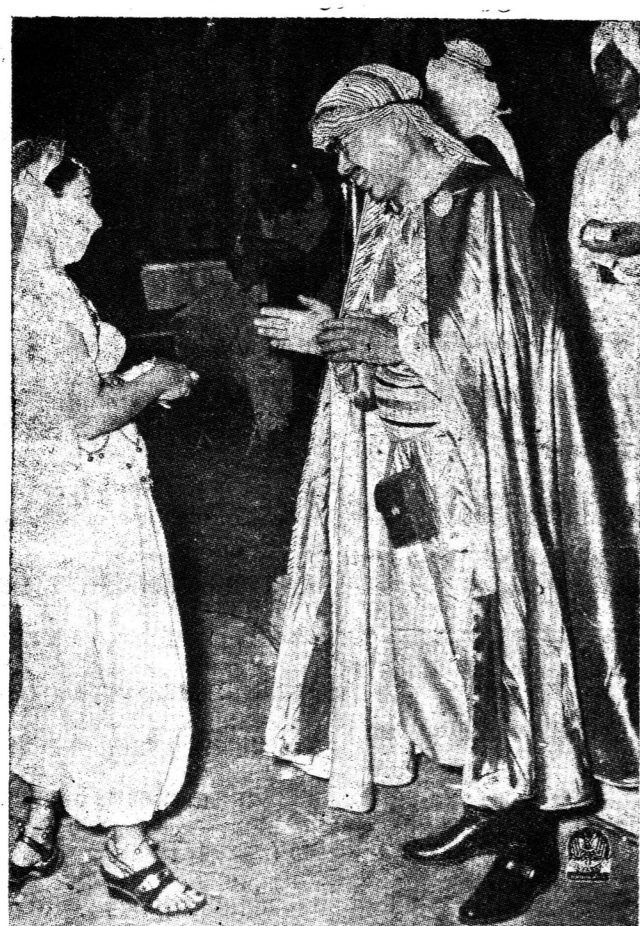
หลวง บุรกรรม โกวท อธิบดี กรม โยธาเทศบาล แต่งเป็น เจ้าอาหรับ

ว่าเสียเงินนับตั้งล้าน ให้ยับยั้ง ขยายสำเพ็ง