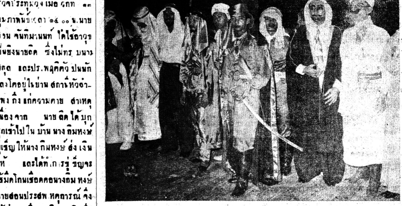
อีกภาพหนึ่งของผู้ที่มางานของชาวสลาบีตย์

แถลงก. กรมพศก.แม่ค้า ทางจว.ราชบุรี ซึ่งมีแถลงข่าวดังกล่าวกม— เรืองนี้ ทามนายพศก— แม่ รัฐบาล ได้พากันไปร้อง ฤทธิ จนพรรคประชาชนกรม ทกรยงหนังสือพิมพ์ เพชรขอ การของสงกม โดยมอเรียว่า ความช่วยเหลือไม่จรรทกแก่ การช่วยเหลือบรรเทาพศก.แม่ หน้าก็ควรจวบกรมจว.ราชบุรี (มคอหน้า ๑๒)