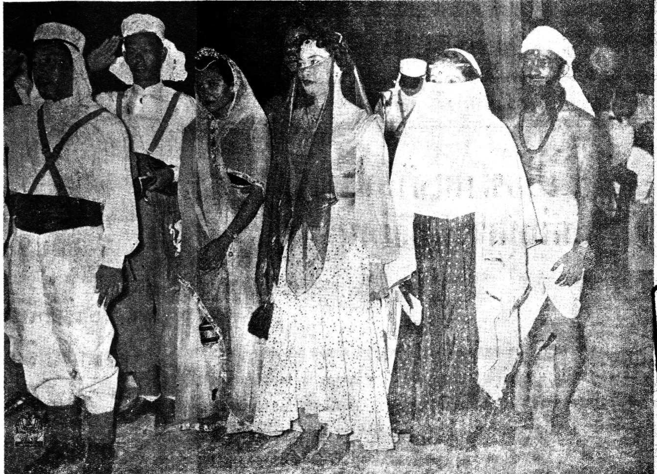
ภาพได้จากงานรื่นเริงของชาวสลาบีตย์ สมาชิกแต่งเป็นชาวอาหรับ คนยืนหน้าคือ นายทหารตั้งตัวคนหนึ่ง

ทางราชการทราบดีว่า สห รัฐ อเมริกาได้ส่งอาวุธที่ไซป กรณ มายังประเทศไทย ความ ความตกลงว่า ด้วยความช่วยเหลือ ทางการทหารซึ่งได้ลง นาม ณ กรุงเทป ฯ เมื่อวัน ๑๗ ตุลาคม ๒๔๙๓ นั้น เฉพาะ ในเดือนกรกฎาคม ๒๔๙๖ ได้ ส่ง มาโดยเรือ รัฐนาวี ของ สหรัฐ และเรือ มินิ ทุกชิ้นค่า รวมค่า รวม ๕ เกษยอาวุธที่ไซปกรณ ที่ ได้รับในเดือนนี้ เป็นของ กองทัพบก กองทัพเรือ และ กองทัพอากาศ รวมทั้งสิ้นคิด เป็นน้ำหนัก ๓,๒๕๕,๔๖๖ ปอนด์.