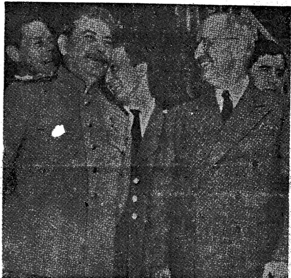
รอยจารึก ระหว่างสถานี...