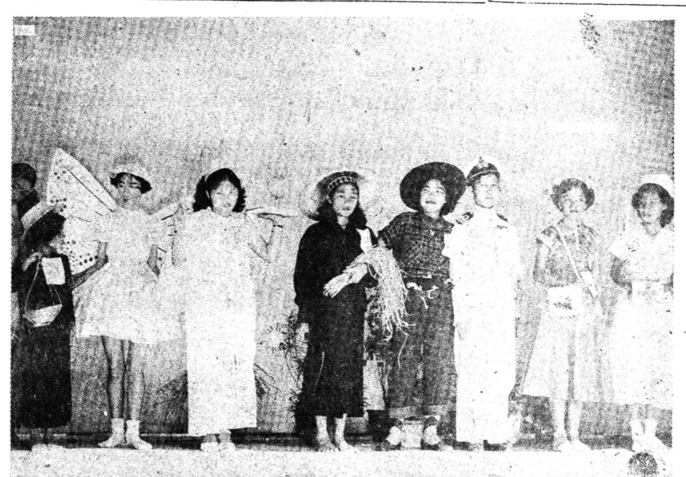
งานรื่นเริงของ ร.ร. พระพุทธย คอนแวนต์ เมื่อวันที่ ๒๐ มี.ค. นักเรียนแต่งแฟนซี