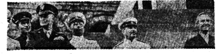
เมื่อโศกพอกยศึกลี้มีมอสโควส์มีชัยผู้บัญชาการ สูงสุด กองทัพพันธมิตรยุโรปและเป็นผู้บัญชาการยกเครื่อง เยอร์มันและเชคสโลวาเกีย ๑๙๔๕

ชาวทากยังแข็งแรง พวก คอมมิวนิสต์ที่มาโจมตีเข้า ปล้นคลังแสงสรรพาวุธ ของ พม่าแห่งหนึ่งใกล้ เมือง ยะไซ และสามารถนำเอาอาวุธหนัก ไปได้ คือปืนกลขนาด ๑๒ กระบอก ปืนสั้น ๑๒ กระบอก ขนเหล็กยาว ๑ กระบอก ระบิก มี ๒๓๐ ลูก และกระสุนขม อีก ๕๕๐๐ ลูก เกิดขึ้นเมื่อวัน อังคารวันที่ ๑๔ เดือน