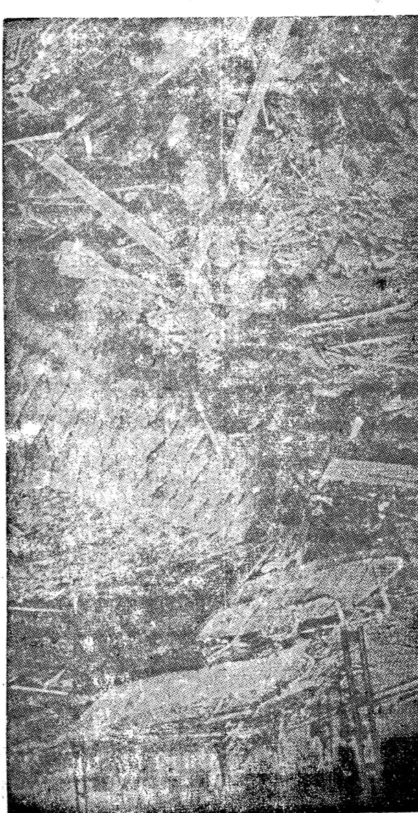
ระเบิดปรมาณูที่ลงในอิโรชิมาถูกแรกเป็นผลจากมหาสงครามโลกครั้งที่สองนี้