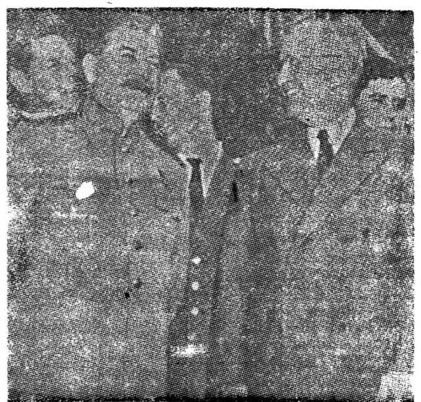
รอยจารึกระหว่างสถานี กับทรูแมน ที่ปอร์ตสแตม