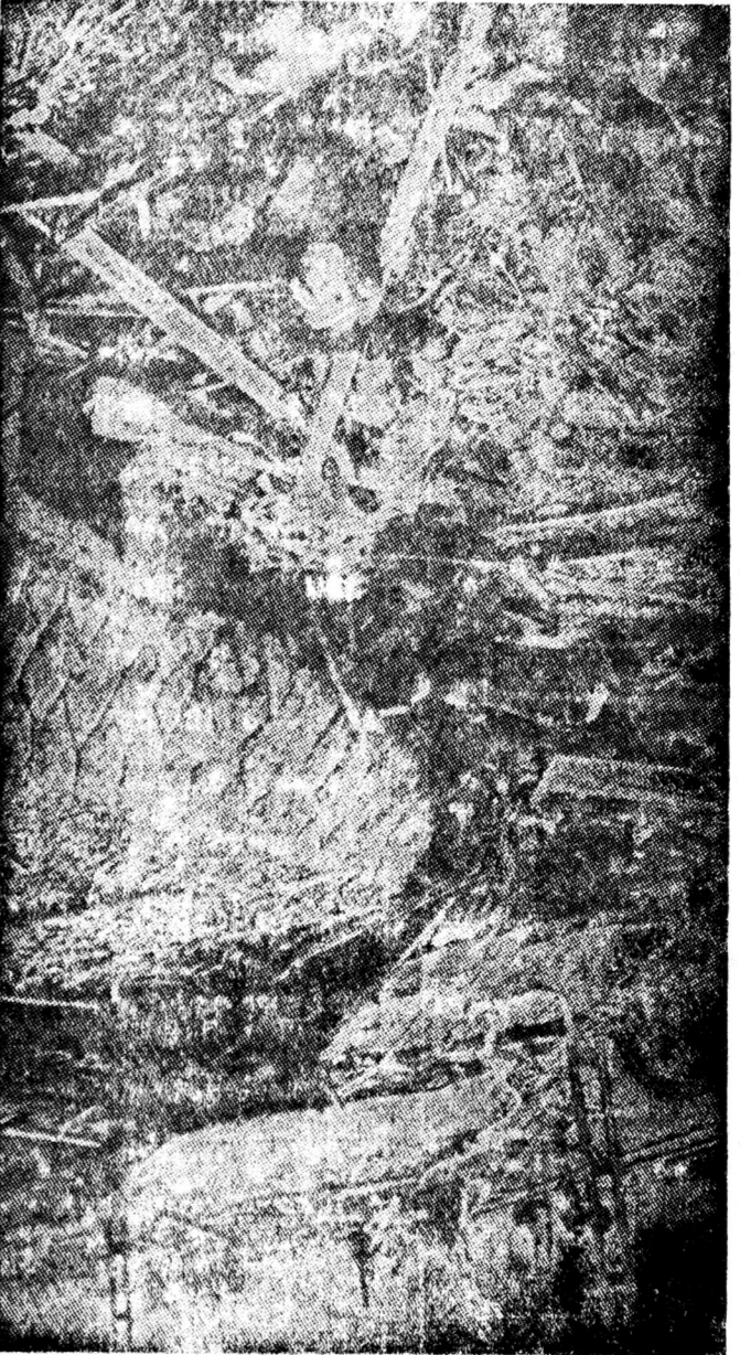
ระเบิดปรมาณูที่ลงในฮิโรชิมาถูกแรกเป็นผลจากมหาสงครามโลกครั้งที่สอง

สงครามโลกครั้งที่สอง... หลังจาก... .. เอเชียบูรพา