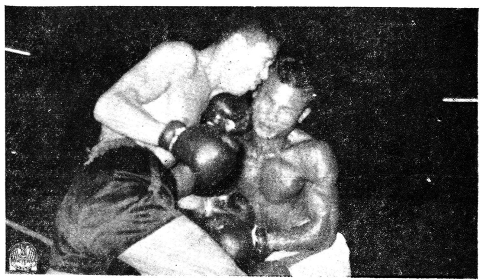
อากิยาม่า ถูกหมัดไอ้หนัดำดิน ศุภชัยถลาไป