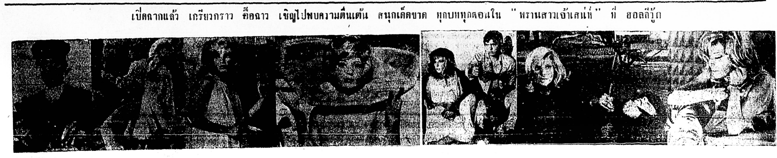
เปิดฉากแล้ว เกรียวกราว อี๋ฉาว เจริญไปพบความตื่นเต้น สนุกตื่นเต้น หุกบกทุกตอนใน "พรานสาวเจ้าเสน่ห์" ที่ ฮอลลีวู้ด

รับสมัครพนักงานขายปลีกจำนวนมาก ผู้สมัครต้องมีความรู้ไม่ต่ำกว่า ม.ศ. 3 (ม. 6) อายุระหว่าง 22 - 30 ปี... (text continues with details about a recruitment drive for retail sales staff)