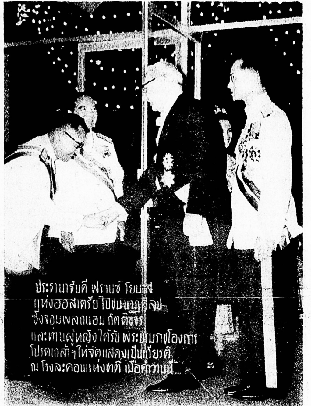
ปรมาจารย์ดี ฟรานซ์ โยบิส แห่งออสโตรีย ไปชมงานศิลปะ ซึ่งจบพลกอบม กิตติจักร และทบทวนให้ได้รับ พระบรมราชโองการ โปรดเกล้าฯ ให้จัดแสดงเป็นเกียรติ ณ โรงละครแห่งชาติ เมื่อค่ำวานนี้...

ฉบับที่ 6358 ประจำวันศุกร์ที่ 20 มกราคม พ.ศ. 2510 ราคา 1 บาท