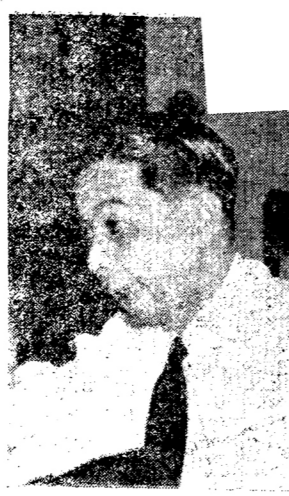
ม.ร.ว. เสนี ปราโมทย์

รัฐบาลกำลังเสนอร่าง พรบ. จัดสรรที่ดินให้แก่ประชาชน ตามข่าวที่เราได้เสนอไปแล้วนั้นและในกรณีนี้ รัฐบาลเปิดโอกาสให้ประชาชนแสดงความคิดเห็นเกี่ยวกับการจัดสรรที่ดินของรัฐบาลนี้ โดยเสรีและอย่างกว้างขวาง เราจึงขอแนะนำคณะของบุคคลต่างๆ ในวง การเมืองและนอวงการเมืองมาเสนอผู้อ่านของเรา เพื่อพิจารณาตามลำดับไป