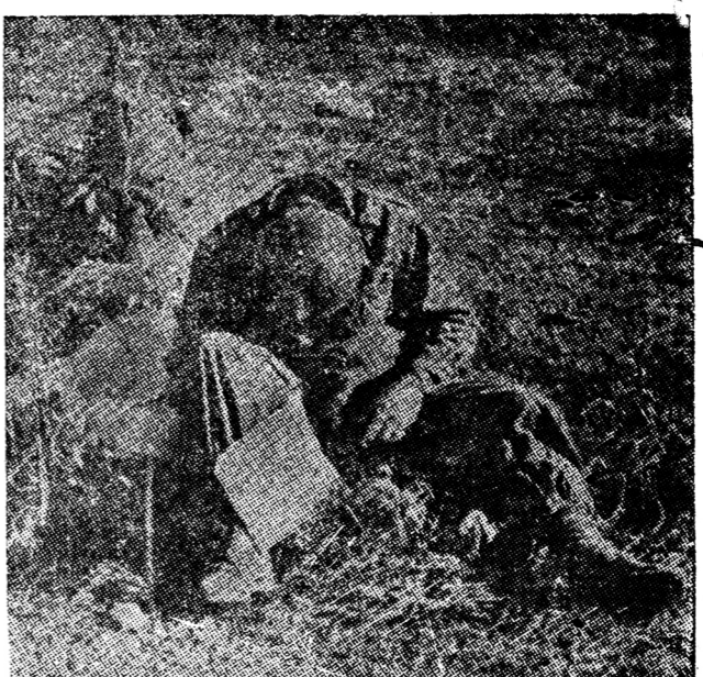
กรณีเกาหลีที่ถูกอ้างในละครเรื่องนี้ ทหารกำลังนำ กลับในสมรภูมิเกาหลี

นักข่าว "ท่านอธิการ แห่งมรัฐเม็กซิโก ได้ บอก แก่ท่าน ประธานาธิบดี ว่า ในระหว่างการ วิวาทกรรม (มีหน้าต่อ...)"