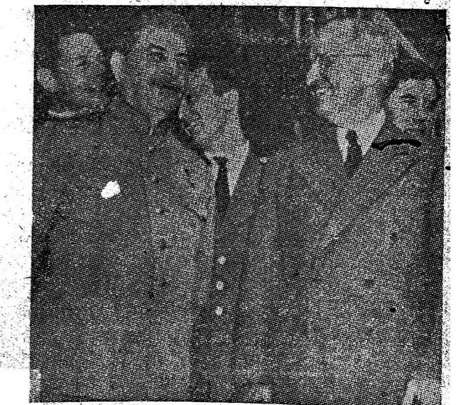
รอยจักรี ระหว่างสถานีกับทรแมน ที่ปอร์ตสตาม

โทรเลขไปถามรัฐบาลของตัวเหมือนกัน เรื่องเดิมคั่งกล่าว และรัฐบาลรัสเซียก็อนุมัติมา