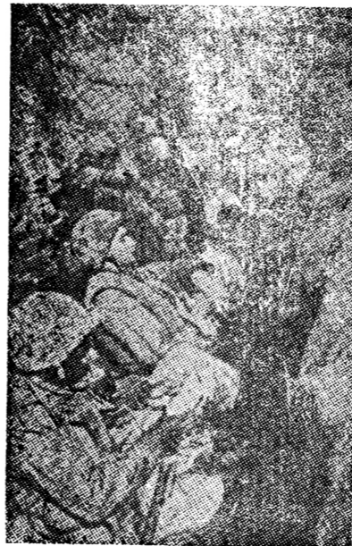
กรณี เกาหลีที่ถูกอ้างในละครเรื่อง-ทห ทกาลังพิภพ

ละครการเมือง เปิดที่ ทำเนียบขาว— มาดใน วัยระริงคืน ภาใน หอง ประชุม มี เกษ ๑๒๐๖ ซึ่ง ตั้ง ไป ด้วย นักหนา ตัวพิมพ์ บนยกพง ทรงกลาง ท่านประ ธานาธิบดี เซอร์ ทู แมน ยืนอยู่ ท่าน เตงกาย ในชุด ดินา เงิน มี สีคหน้าสี เงิน เสนอจากปากกระ ดอง เน็ค โทกดูสี เงิน ชนกัน การให้