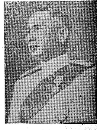
ท่านจอมพลของเรา ธันวาคม ๒๕ ๕๕

รัสเซียกับเชโกสโลวาเกีย จะโฆษณาประกาศให้ประชาชนฟังจึงไม่มีเวลาที่จะตั้งใคร่ครวญไปให้รัฐบาลรัสเซียทราบได้ พอลงกรณ์ เชอวชีลก็ยังไม่และคิดว่าลิตวินอฟ ในกรณีอย่างนี้ ลิตวินอฟไม่ได้เป็นเอกอัครราชทูต เพราะไม่มีอำนาจที่จะโต้แย้ง แม้จนจะเดิมทีก็อาจตกลงไปไม่ได้ อีกอย่างหนึ่ง ในยามนี้ เป็นยามสงคราม จะมิได้ยอมเล่นเพลงยาวกันนั้น ไม่ได้ เชอวชีล ยังบอกอีกว่า รัฐบาลเชโกสโลวาเกียจะเปลี่ยนแปลง ก็อย่าทำอะไรแล้ว ทางเชอวชีลก็จะตกลงทันที ทั้งประเทศต่าง ๆ ก็คงจะเห็นด้วย