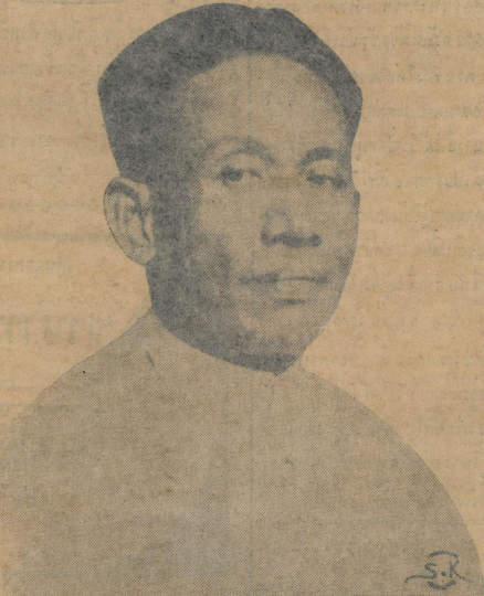
สมาชิกสภาผู้แทนราษฎรผู้ ๑ (บรรณาธิการ หน้า ๘)

ข้าพเจ้าและคณะราษฎร ได้พยายามที่จะปรับปรุงการศึกษาของชาติให้ดีขึ้นกว่าเดิม โดยมุ่งหมายที่จะปรับปรุงการศึกษาของชาติให้ดีขึ้นกว่าเดิม